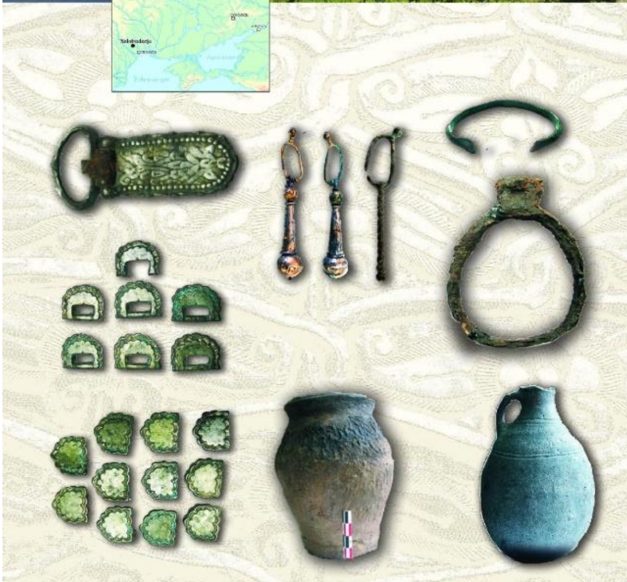
A Dnyeszter folyó és a Szubbotyici-horizont jellegzetes leletei Szlobodzeja lelőhelyről