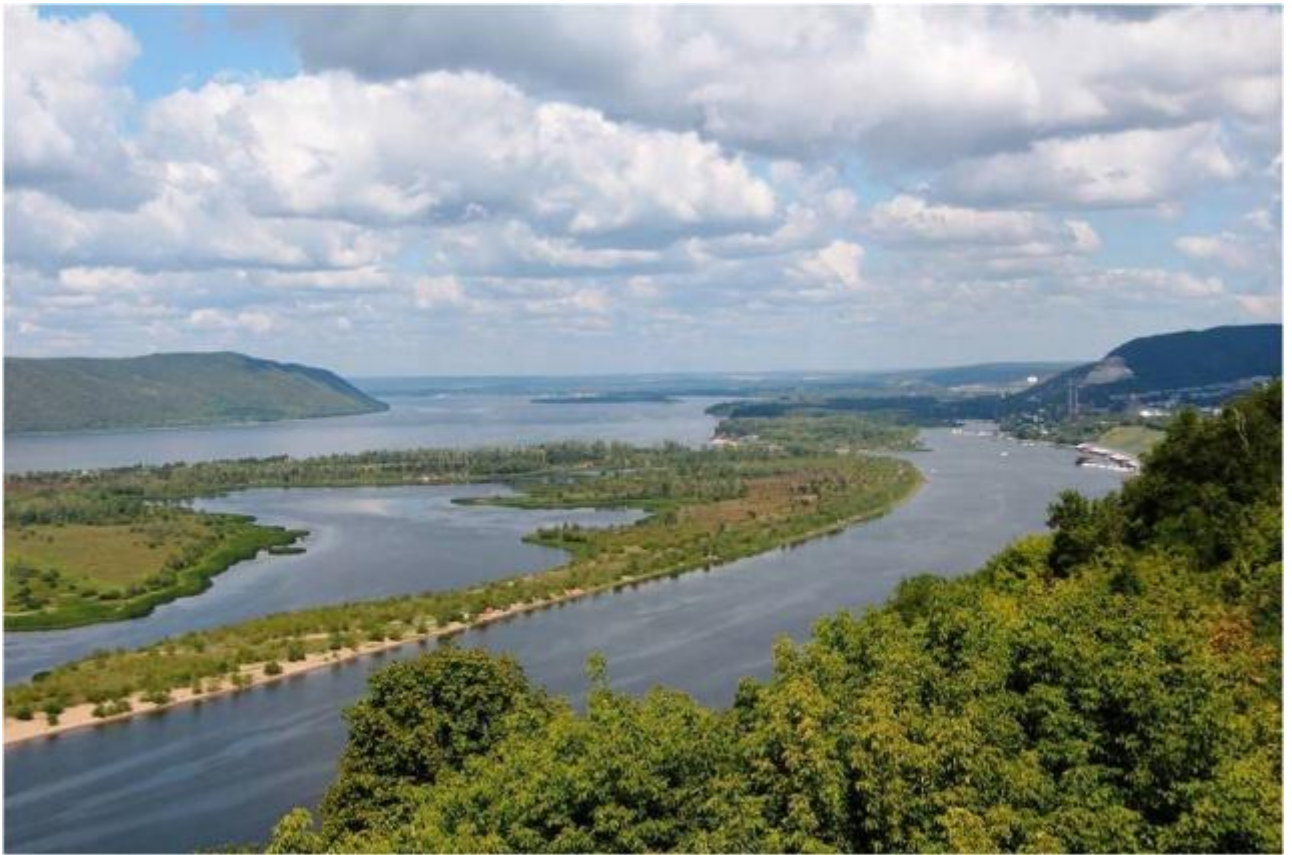
A Volga folyó a szamarai Volga-könyöknél

Ezen a hatalmas folyón nem lehetett bárhol átkelni, a középkorban igazolhatóan használt gázlók és átkelőhelyek ismerete alapvető fontosságú, és támpontot adhat. A Volga bal partján pedig hat-hét olyan, 8–9. századi lelőhelyet ismerünk (pl. Nyemcsanka, Proletarszkoje gorogycse, Vlaszty truda stb.), melyek magyar szempontból figyelemre méltóak. Itt a fémleletek mellett az uráli jellegű kerámialeletek feltűnése a meghatározó jelenség (Bakalszkaja-, illetve kuszarenkovói és karajakupovói kultúra). A folyó bal partjának kora középkori leleteiből látható, hogy a hun kortól a 9. századig két-három időszakban is történt uráli eredetű betelepülés. A folyó jobb partján pedig a Kazár Kaganátus belső területeiről ideköltöző, valószínűleg török nyelvű népeket (Novinki-horizont) ma már a 8. század elejétől valószínűsít a kutatás. Azt, hogy a magyarok mikor és főként miért keltek át a Volgán, és költöztek nyugatra, ma még nem tudjuk. Azonban joggal feltételezzük – miként később a besenyők esetében erről az írott források is beszámolnak –, hogy erre az eseményre valószínűleg nem kerülhetett sor a kazárok közreműködése, hozzájárulása, szövetsége nélkül. Okként a Dél-Urál előterében a 8–9. század fordulóján déli irányból feltűnő besenyő, esetleg a keleti irányból feltételezhető kimek törzsek (régészetiileg: Szrosztkinszkaja-kultúra) „hatása” tűnik valószínűnek. Időrendileg pedig a 9. század eleje – középső harmada jöhet szóba.