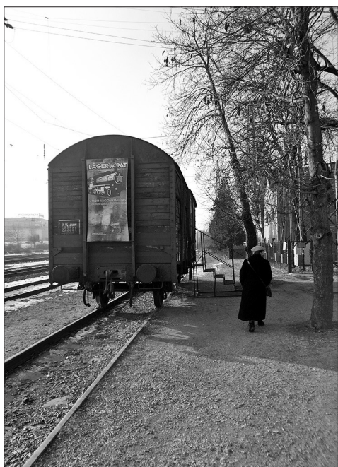
A kiállítás helyszíne, a teherszállító vagon

A tematika szerint 2016–2017-ben a vagon azokon az állomásokon volt látogatható, ahonnan a 0060. számú parancs szerint 1944-ben és 1945-ben internáló transzportok indultak a Szovjetunió lágereibe. A kiállítás megtervezésének