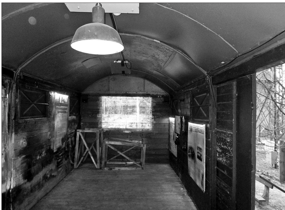
Részlet a kiállításból

fontos momentuma, hogy a parancs nem a háborús bűnösökre, német állampolgárokra, vagy német anyanyelvűekre terjedt ki, hanem a tiszta faji alapú meghurcolás mintapéldája volt, még akkor is, ha az végül az ország teljes lakosságát különböző okokból (tisztogató, létszámkiegészítés) érintette, ezért a kiállítás számukra is emléket állított, bárminemű nemzetiségi hovatartozás nélkül. A korábban említett állomások mellett Budapesten két alkalommal is látogatható volt (elsőként a Nyugati pályaudvaron 2016. 02. 24. és 2016. 03. 15. között), innen indult útjára Ceglédre (2016. 03. 19.–03. 30.), majd Kálkapolnán (2016. 04. 03.–04. 13.) látogathatta meg a nagyközönség. Ezután Miskolcra (2016. 04. 15.–05. 05.), majd Szerencsre (2016. 05. 08.–05. 18.) és Debrecenbe (2016. 05. 22.–06. 22.) szállították a vagon. Majd a balmazújvárosi (2016. 06. 25.–07. 14.), gyulai (2016. 07. 16.–09. 16.) és kiskunhalasi (2016. 09. 21.–10. 03.) kiállítás következett. A bajai megálló (2016. 10. 08.–11. 03.) után Szekszárd (2016. 11. 05.–11. 22.) és Pécs (2016. 11. 24.–2017. 01. 15.) lakosai is megszemlélhették a vagon, amely Budaörsön (2017. 01. 18.–02. 25.) fejezte be útját, 2017. augusztus 26-án és 27-én pedig ismét megszemlélhették a látogatók a budapesti Vasúttörténeti Parban.