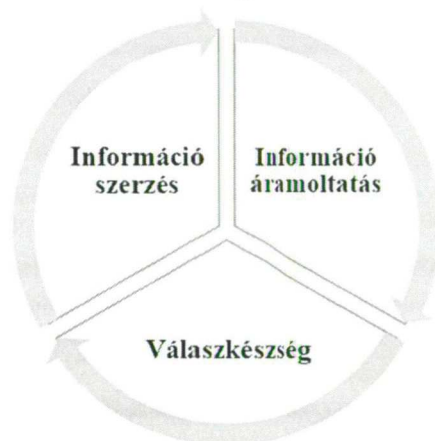
1. ábra: Kohli és Jaworski piacorientációs modellje