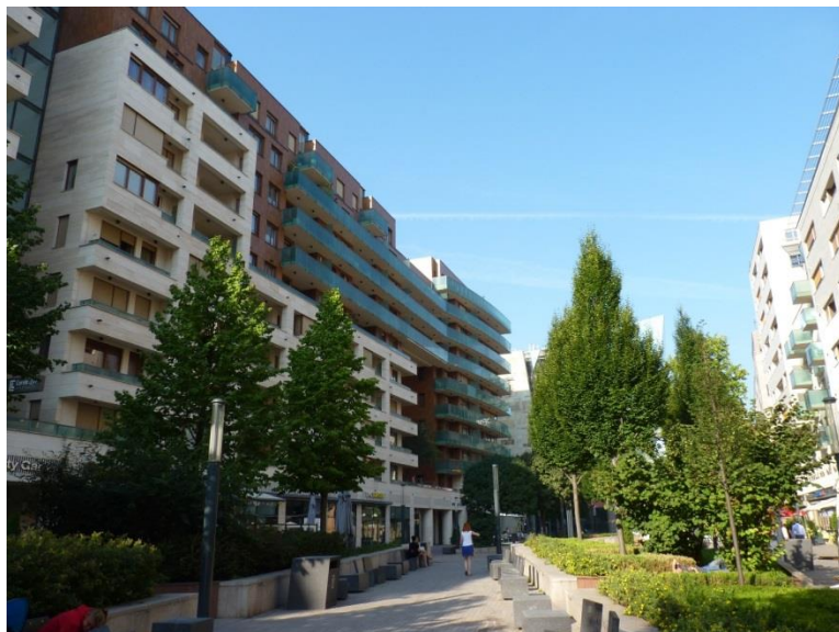
1. kép A Corvin-sétány.

Az interjúkban a VIII. kerületet többnyire egy sokszínű városrészként jellemezték. A leggyakrabban az életkort, a nemzetiségi és etnikai hovatartozást, az életstílust, az anyagi helyzetet és a munkaerőpiaci helyzetet emelték ki, mint a különbségek dimenzióit. Józsefvárost a városrehabilitáció következtében egy gyorsan változó területként írták le, ahol sok belföldi és külföldi beköltöző, bevándorló él. A leggyakrabban említett csoportok: problematikus vagy fenyegetőnek tartott emberek, bevándorlók és új beköltözők, szegények, valamint a régóta a kerületben élők, ezen belül különösen a nyugdíjasok, idősek.