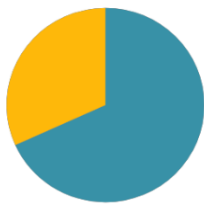
Reintegrációs őrizetsek megoszlása (362 fő)

Megyei intézetek (247 fő) Végrehajtó intézetek (115 fő)