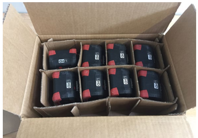
2. ábra: Károk (DGR, ISTA, FedEx)

Zsákok esetén a veszélyes áru szabályozás szerinti vizsgálat igen enyhe, és mind a Fedex és ISTA szerinti jelentősen rosszabb eredményt adott annak ellenére, hogy az ejtési magasság alacsonyabb, mert ez esetben az ejtési pozíció szintén nagyon fontos.