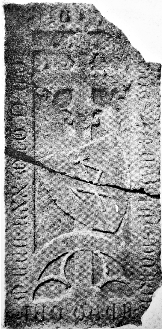
► 2. kép. Kassa (Košice, Szlovákia), Szent Erzsébet-templom: Jacobus Polonus (†1378) sírköve (fotó: Fróde, „Felső-Magyarország középkori épületeinek kőfaragó jelei,” 7. ábra)

A kő körüli hírverésre gyorsan felfigyelt az egyik televíziós hírmagazin is, a talányok vizuális példajaként, transzcendens fényjelenségekként mutatva be néhány a kőről polaroid fényképezőgéppel készült, csupán vöröses elszíneződést mutató felvételt. 7 „Egy szórakoztató történet szerint az RTL Klub stábjának tönkrementek a készülékei, a riportereknek pedig megfájdult a feje, amikor műsort készítettek a szent kőről, mivel ‘nem megfelelő’ lelkiállapotban közeledtek felé.” 8 A faragvány sugárzásának tulajdonított produkció azonban a fényképezőgép egyszerű hibájából adódhatott – ha ugyanis nem erről lett volna szó, akkor sem a polgármester, sem az újságok fotósai, sem a televíziós műsor operatőrei (nem is beszélve utóbb jelen sorok írójáról) nem készíthettek és publikálhattak volna tökéletes felvételeket a darabról.