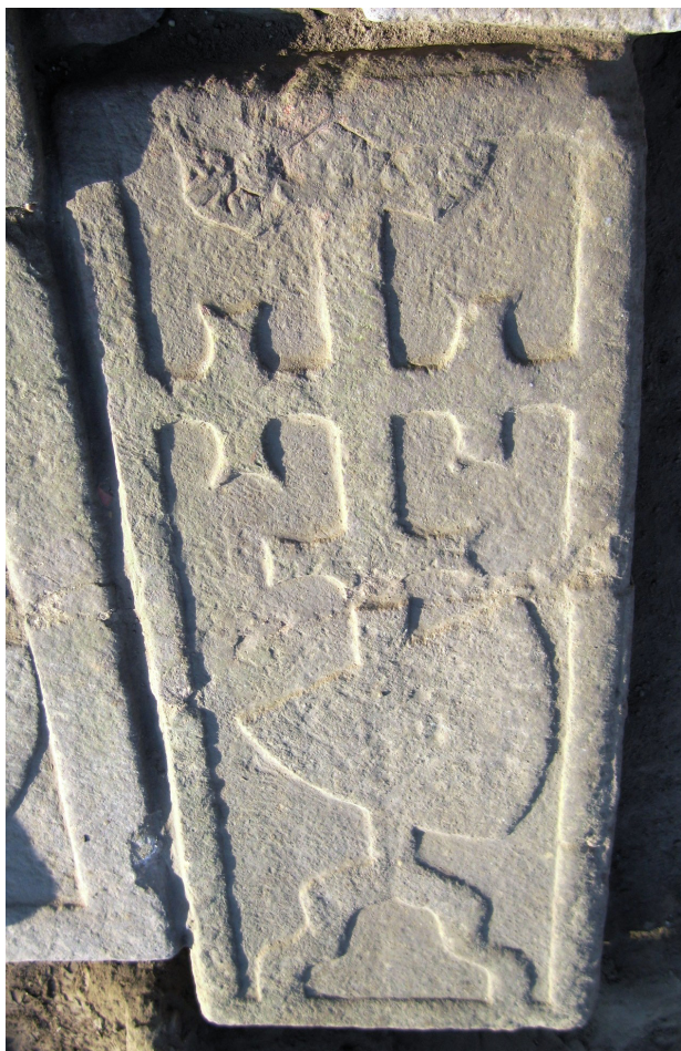
► 3. kép. Vác, középkori plébániatemplom: ismeretlen sírköve, 14. század első fele-közepe; Tragor Ignác Múzeum