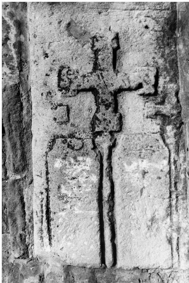
► 5. kép. Vízkelet (Čierny Brod, Szlovákia): ismeretlen(ek) sírköve, 12–13. század

A pilisszántói faragványon látható két kisebb kereszt analógiái viszont nem fedezhetők fel sem a kassai, sem a többi velük rokon emléken, de ezekre is található párhuzam a középkori Magyarország sírkövei között. Vízkelet (Čierny Brod, Szlovákia) község román kori templomának nyugati homlokzatában egy kisebb, befalazott kőtáblán hosszú szárra ültetett, négyzetesen kiszélesedő szárvégződésű kereszték láthatók, középen egy nagyobb, kétoldalt egy-egy kisebb (5. kép). 14 Valószínűleg három személy közös sírköve: egy férj első és második feleségével, vagy szülő gyermekeivel. Kora a 12–13. századra tehető, a templom falába már másodlagosan, építőkként megcsontkítva használták fel. Egy további analógia Felsőörsről is ismert, ahol egy sírkőtöredéken egy nagyméretű kereszt felső szárának két oldalán található egy-egy kisebb kereszt (6. kép). 15 A fentiek alapján igencsak valószínű, hogy a pilisszántói faragvány kisméretű, családi sírkő, amely meglehetősen sajátos gótikus stílusban készült, való-