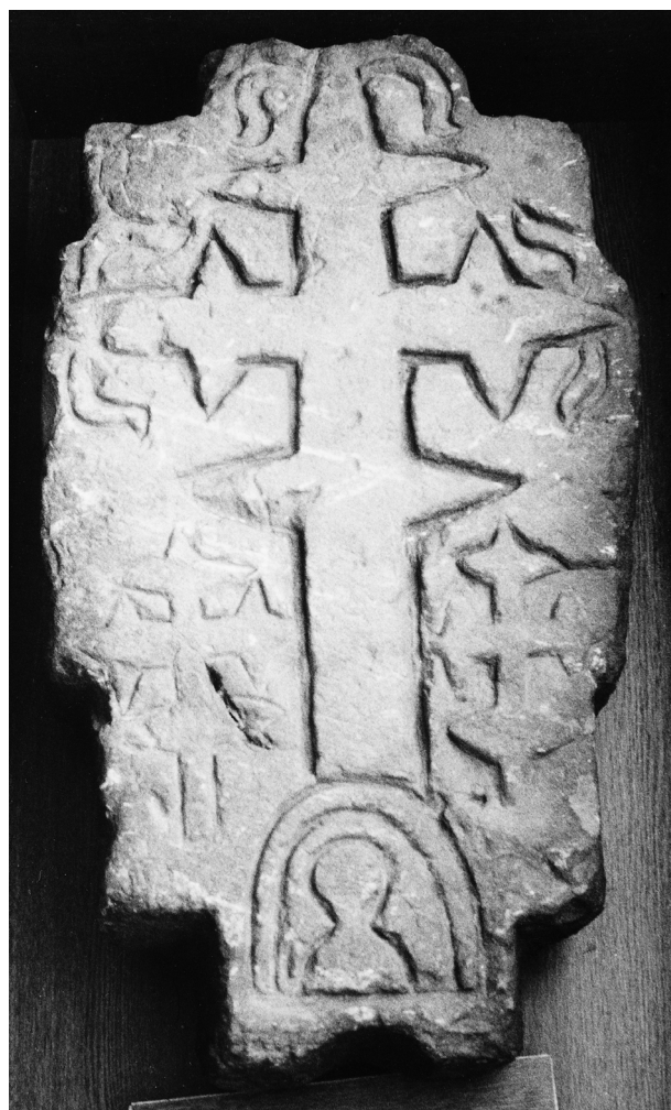
► 1. kép. Pilisszántó: ismeretlen sírköve, 14. század második fele

kodó, féltő tisztelet jellemezte a titok megfejtésén fáradozó összes szereplőt. A több tucat hozzászóló mindegyike a maga területén elfogadott, elismert tekintély. Láttá már művészettörténész, bioenergetikus, múzeumi szakember, látó, régész, egyházkutató, őstörténet kutató, ezoteriával foglalkozó, intézmények, médiák képviselői és mások, akik a kő vonzókörébe kerültek. Mindegyik szereplőnek létjogosultsága van. [...] A vélemények meglehe-