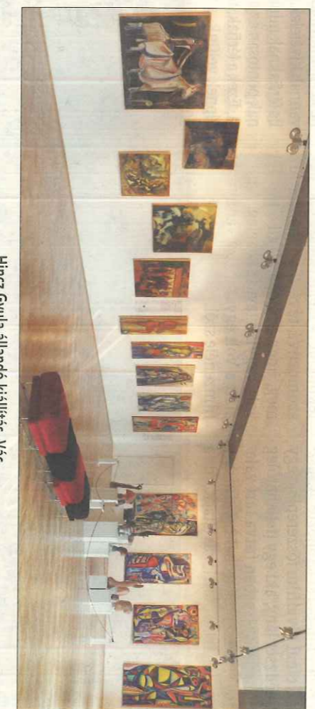
Hincz Gyula állandó kiállítás, Vác