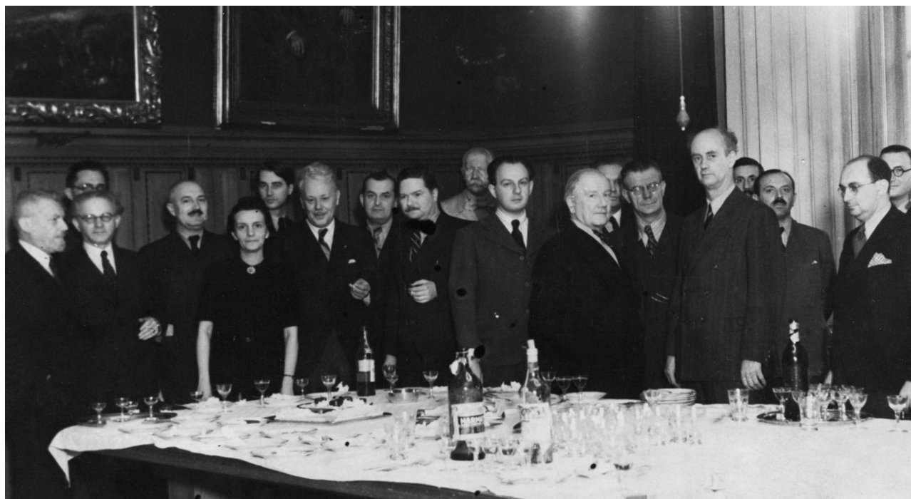
Wilhelm Furtwängler a Filharmoniai Társaság tiszteletbeli tagjainak sajtótájékoztatóján a Zeneakadémián, 1938. november 17-én. Mellette baloldalon Dohnányi, mögötte pedig az Emléktár őre, Csuka Béla

E forrásokon kívül a korabeli sajtóorgánokban is csupán szórványosan találkozhatunk a Társaság gyűjteményeiről szóló híradásokkal. A Budapesti Hírlap újságírója, Innocent Ernő, 1935-ben a zenekar tagjainak derűs emlékeit közreadó írásának bevezetőjében festi le az együttes mindennapjait körülvevő környezetet: itt említi elsőként a már említett könyvtár mellett a Filharmoniai Társaság múzeumát. 4 Minden bizonnyal ez utóbbi – a cikk szerzője által azonban meg nem nevezett – helyiségben kapott helyet az együttes irattári és tárgyi emlékeit őrző, ám ezúttal más elnevezéssel megjelölt Emlékgyűjtemény,