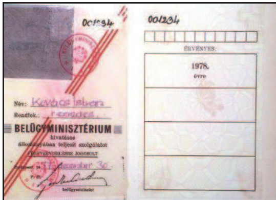
Az 1978. évi háromsávós vezetői igazolvány.