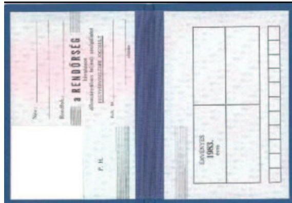
Az 1983-ban bevezetett rendőrségi igazolvány.