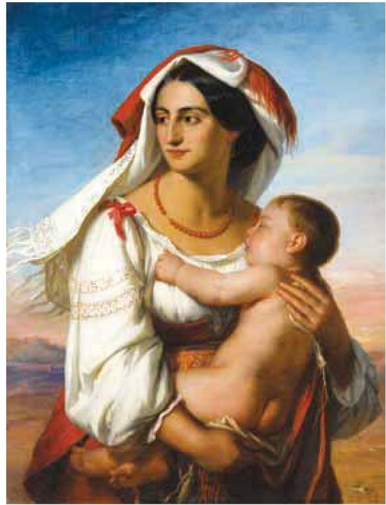
I/15 ■ Kovács Mihály: Olasz nő , 1848–1851

A magyarországi képzőművészeti akadémia létrehozására irányuló legkorábbi törekvések – a magánkezdeményezésre megalakult bécsi akadémiával ellentétben – rendi-nemesi keretek között jelentkez-