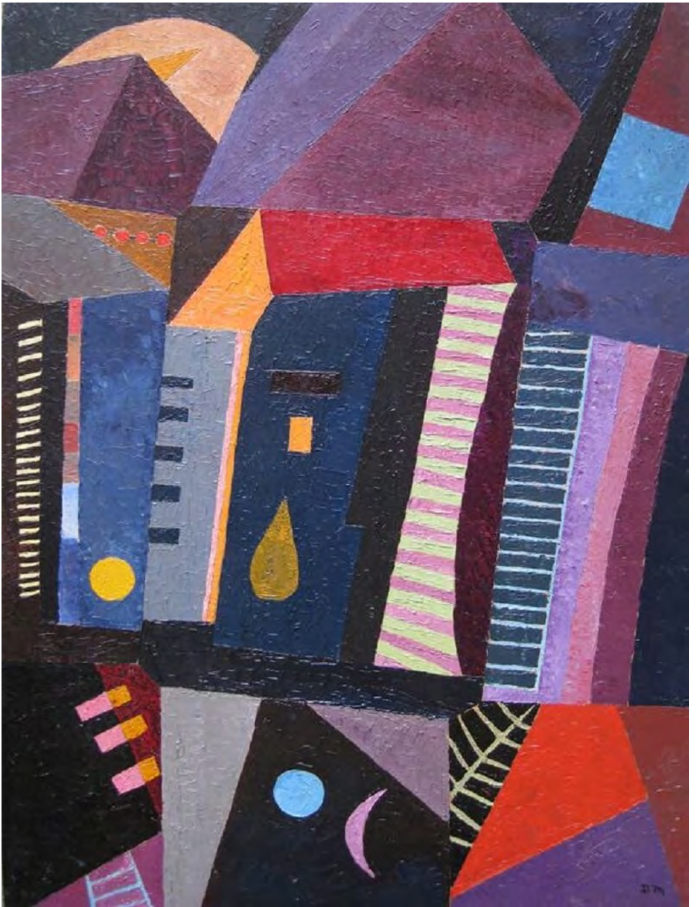
Denise Mannoni: Padlásszobák, pinterest.com