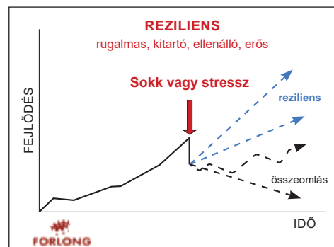
1. ábra. Reziliencia definíciója