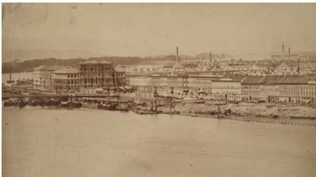
CONSTRUCTIO 13.2 Ismeretlen fényképész: Az épülő akadémiai palota a beállványozott rizalittal, 1864 Fénykép, 58 × 100 mm Budapesti Történelmi Múzeum Kiscelli Múzeum, Fényképgyűjtemény, ltsz. 32.786

Míg a Magyar Tudományos Akadémia építési bizottsága a főépület szobrászati díszének kivitelezését (Izsó Révai-szobrát nem számítva) berlini művészekre bízta, addig a szintén Stüler által tervezett – és az Akadémia palotájával párhuzamosan épülő – stockholmi Nationalmuseum homlokzati szobrait Carl Gustav Qvarnström (1810–1867) és Johann Peter Molin (1814–1873) svéd szobrászok készítették; ráadásul a portrék kivétel nélkül svéd tudósokat és művészeket (Carl Gustaf Tessin [1695–1770] és Johann Tobias Sergel [1740–1814] egészalakos szobrai; Jöns Jacob Berzelius [1779–1848], Esaias Tegnér [1782–1846], Johan Olof Wallin [1779–1839], Carl von Linné [1707–1778], David Klöcker Ehrenstahl [1628–1698] és Bengt Erland Fogelberg [1786–1854] büsztjei) ábrázolnak. 7 Mindez persze adódik a pesti és a stockholmi épület funkciójának különbözőségéből, de abból is, hogy a Magyar Tudományos Akadémia épületszobrászati programjának koncipiátorai a tudományok nemzetek fölöttiségét kívánták hangsúlyozni.