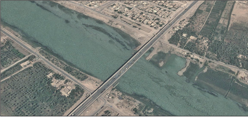
12. ábra. Az Eufrátesz hídja Nasiriyah keleti térségében

3 méterre robbant előtte. A lökeshullám megint a földre lökte. De ismét fel tudott állni. A robbanás teleszórta arcát srappellal és az egyik szeme súlyosan megsérült. Arra gondolt megvakul. Odarohant az aknavetők láncfalpasáshoz és megkérdezte a személyzettől: