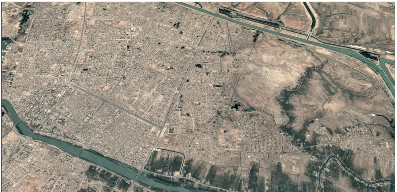
11. ábra. Nasiriyah keleti részének műholdképe

Időközben a század többi része is átkelt a csatornán. Wittnam százados és szakaszparancsnokai „halszálka” formációban állították le a láncfalpasokat, kiszállították a tengerészgyalogosokat, akik észak-déli irányban elnyújtott körkörös védelemre kezdtek berendezkedni. Az első és az utolsó jármű között mintegy egy kilométer távolság volt. A „Charlie” század tehát hídfőt létesített, de az eredeti tervhez képest a „Tank” és Gépesített” csoport támogatása nélkül. 35