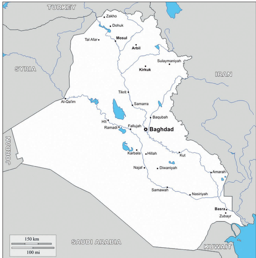
8. ábra. Irak áttekintő térképe

A C211-es AAV néhány méterre William Schafer őrmester AAV-jától (C201-es) állt meg. Schafer odarohant a találatot kapott járműhöz, hogy segítsen. Kinyitotta a hátsó kis ajtót, a vészkijáratot. Az ajtón füst ömlött kifelé, miközben a tengerészgyalogosok gyorsan kimásztak az égő páncélosból. Miután mind kiértek, összegyűjtötték az egységet és kiszedték a sebesülteket, akiket gyorsan levittek az útról az ellenség tűzvonalából. A négy sebesültet a felcser vette gondozásába. 33