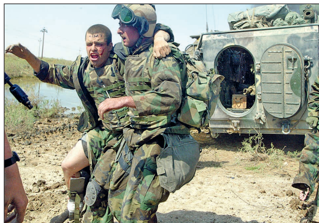
7. ábra. Sebesült evakuálása