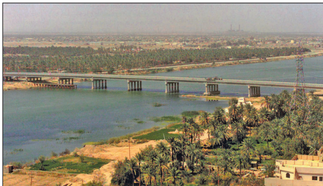
6. ábra. Az Eufrátesz hídjának Nasiriyahnál