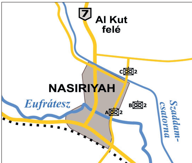
10. ábra. Az 1. tengerészgyalogos-zászlóalj harccsoportjainak helyzete 2003. március 23-án, 13 óra körül