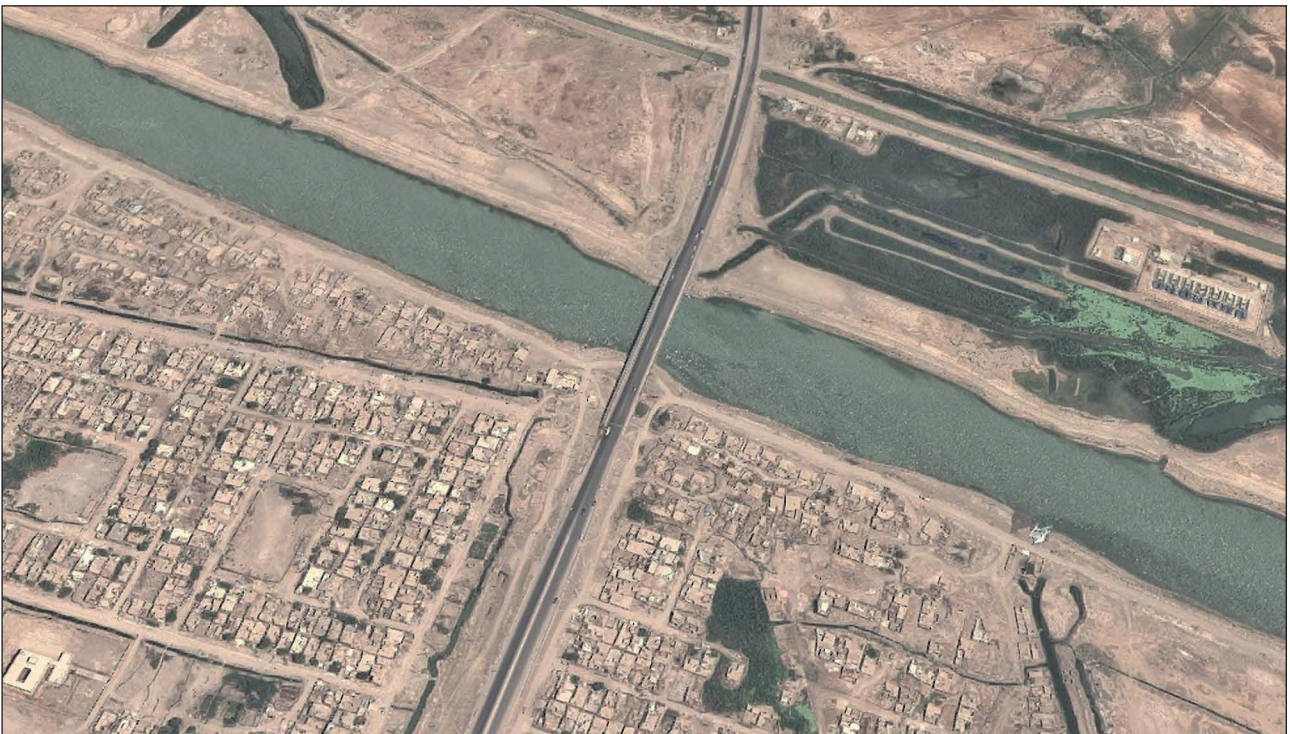
13. ábra. A Szaddam-csatorna hídja, és közvetlen környékének műholdképe

A baleset után a C201-es összes tengerészgyalogosa beszaladt az út melletti házba. Közben a C208-as vezetője és a harcjármű parancsnoka kímásztak a szétroncsolt AAV-ből. Mindketten mesebesültek, de csodával határos módon életben maradtak. A két sebesült ahhoz a házhoz biceget, ahol a többi tengerész-