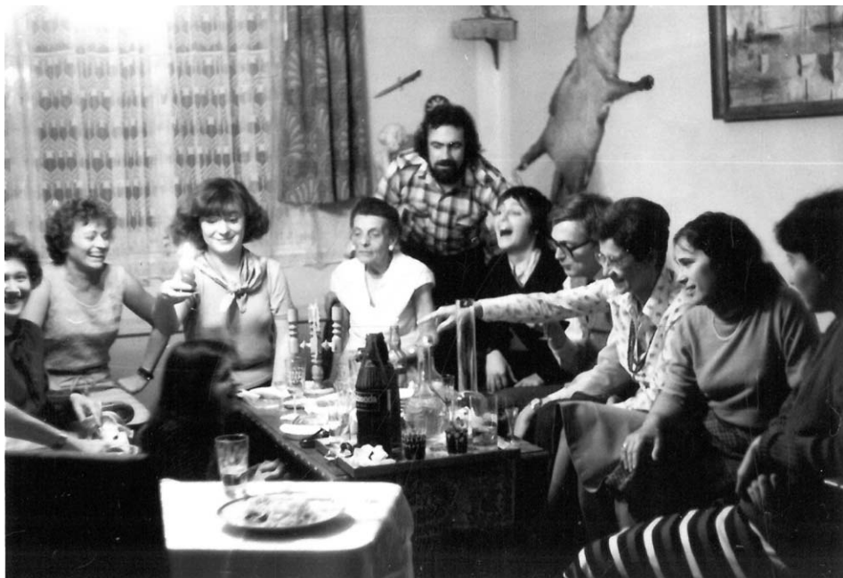
6. melléklet. Az 1984-ben készült fényképen a 20. századi kutatások néhány belső- és külső munkatársa is látható.

folytatódó kötetmunkák programját is megalapozta. Mindazonáltal megfogalmazásának éve mind személyi, mind tudományos tekintetben olyan fordulópontot jelentett, amely a kötet sorsát, gyakorlati megvalósítását illetően kedvezőtlenül hatott. Tallián Tibor 1987-től átmenetileg külföldre távozott, és visszatérését követően néhány évig csak külső munkatársként maradt kapcsolatban az intézettel. Távollétének éveiben tanulmányokkal járult hozzá a kötetterv zenei intézmény- és műfajtörténeti kidolgozásához: elkészítette a 20. század operatortörténeti fejezeteit. Mindezzel párhuzamosan ugyanakkor a 20. századi kötet előkészítésében betöltött vezető szerepe előbb néhány évre, majd a későbbiekben – más körülmények okán – véglegesen megszűnt. A 20. századi kötet újabb kutatás- és gyűjteménytörténeti periódusában (1987-től 2007-ig) Tallián vezetői feladatkört töltött be az intézetben, 1995-től igazgatóhelyettesi, 1998-tól igazgatói minőségben. 56 Új munkakörének és megváltozott kutatói programjának következtében 20. századi kötet szerzői