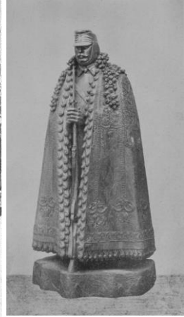
2–3. kép: A Kárpátok Őre avatása (1915. aug. 18.)