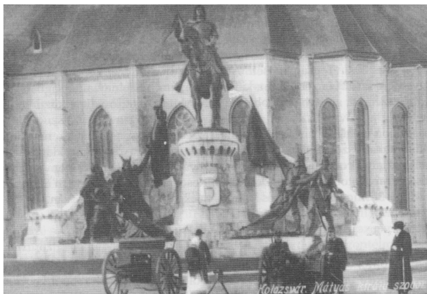
1. kép: A Mátyás-szobor előtt közszemlére kitett hadizsákmány orosz és szerb ágyúk (1915. jan. 4.)

In my study I am interested in observing the appearance of the memory of WWI in the public sphere of Cluj during and after the war, the methods, tools, festive occasions and forms that were used to keep the interest alert, respectively to sustain the feeling of involvement of the civilian population. The world war that was started with the Austrian–Hungarian declaration (28 July 1914) constructed a new type of hero in publicity: the heroic dead. I consider that it is important to present the major functions of memorial actions and commemorations: the assigning of events outside/beyond locality to a certain space, the presentation of the (victorious) war, the editing of the biography of the hero sacrificing himself for his country, the stimulation of civilian will for sacrifice.