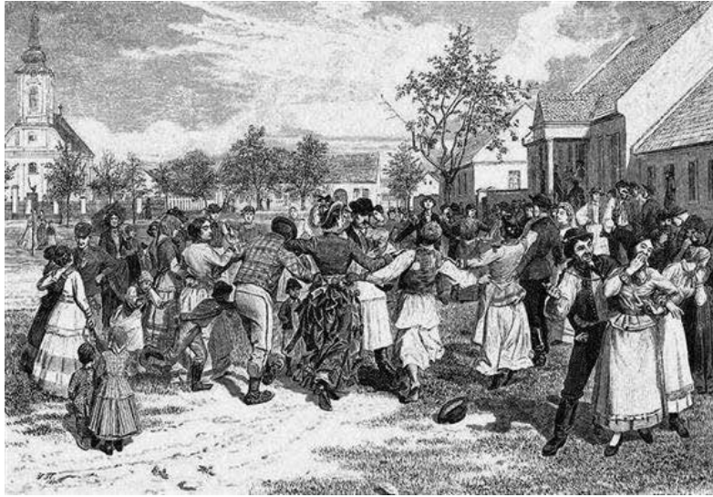
Predics Ulos: Szerb kolo-tánc

A bemutatott táncgyománny-képek a korszak néprajzi szemléletének megfelelően a legtöbb esetben statikusak, időtlenek. Eközben tetten érhető az a törekvés is, hogy a régiben keressék a helyileg sajátosat, illetve a jelen táncgyománnyában is a régiséget, az „ősi hagyományt” hordozót akarják megmutatni. Ilyen régi szertartásosságot hordozó táncként jelenik meg a tiroli farsangi csengettyűstánc: