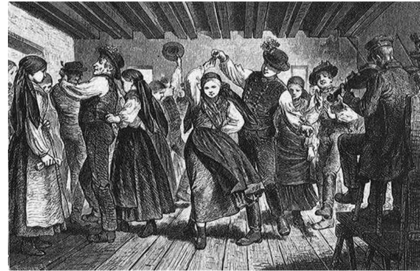
Greil Alajos: A „landler”-tánc (Az Osztrák-Magyar Monarchia írásban és képben. Felső-Ausztria és Salzburg. 137. o.)

A dél-magyarországi szerbeket bemutató néprajzi fejezetben Hadzsics Antaltól a kólóról mint jellegzetes szerb táncról (zenekíséretéről, a táncvezetőről, a tánc motívumáról, térformájáról, a tempóbeli és dinamikai fokozásról) olvashatunk: