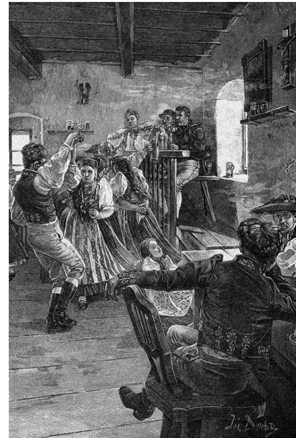
Douba József: Korcsmai tánc (a Tausi kerületből).

Az Osztrák-Magyar Monarchia írásban és képen köteteiben néhány elenyésző számú egyéb tánc-történeti utalást leszámítva hangsúlyosan az egyes vidékek népi táncalkalmi és tánci kerülnék a szemünk elé. A hagyományos táncokról szóló bemutatások a különböző régiók, tájak népének jellemzéseinek kapnak helyet. E néprajzi leírásoknak még korszakunkban is kötelező részei a különböző népjellem-bemutatók. A népszerűnek szánt kötet sorozat lapjain bőven helyet talál az etnikai karakterológia, az esetek többségében pozitív felhanggal. 10 A néprajzi fejezetek szerzői e népjellemrajzokban rendszeresen hangsúlyozzák, hogy egy-egy nép, népcsoport mennyire tánc- és zene-, illetve általában mulatságkedvelő. Sorra olvashatunk leírásokat a tiroliak, 11 a csehek, 12 a