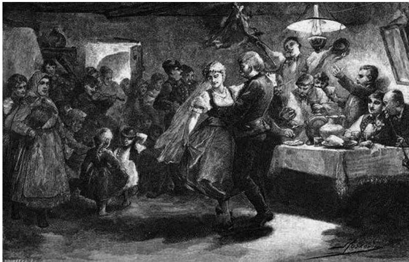
Roskovics Ignác: Menyasszony-tánc