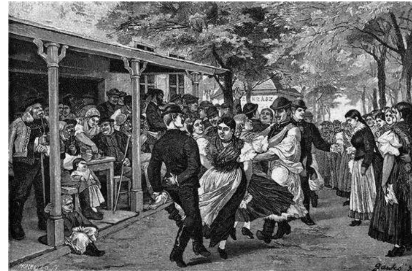
Jankó János: Népmulatság Békés-Csabán

Egy az alföldi kötetben megjelent, Jankó János festő (a néprajzkutató Jankó János édesapja) által készített kép békéscsabai népmulatságot mutat be. A kötetekben máshol is találunk táncos témájú népleletképeket, melyek a korabeli népszerű sajtójának is kedvelt illusztrációit jelentették.