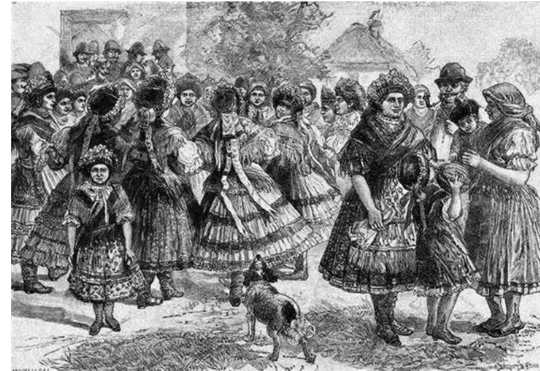
Kimnach László: Sárközségi leányok a játszón (Az Osztrák-Magyar Monarchia írásban és képben. Magyarország IV. kötet. 277. o.)

évtizeden belül mint már a Sárköz néprajzi-turisztikai látványossága bukkan fel forrásainkban. A táncot bemutató kép kedvelt illusztrációja lett táncfolklorisztikai írásainknak is.