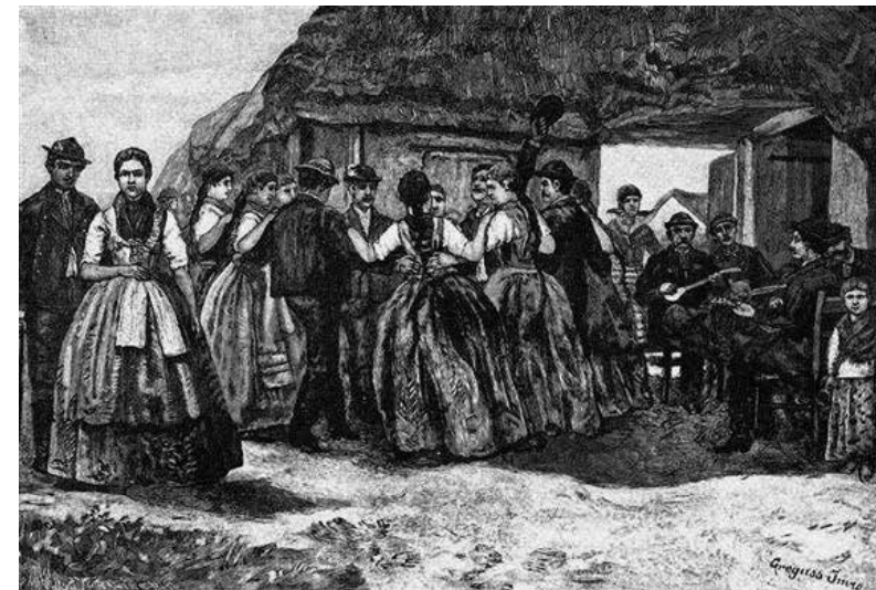
Greguss Imre: Bunyevác kolo

A néprajzi ismertetések szinte mindegyike megemlíti a „helyi”/„nemzeti” táncokat. Itt elsősorban azokat a szórakozó táncokat nevezik meg, amelyeket az adott népre, régióra jellemzőnek ítélnék. A felbukkanó táncok többsége a 19. századi nemzeti mozgalmak idején nemzeti táncokként kiemelt és szimbolikusá váló táncok, a német-osztrák valcer, a magyarok verbunkja és csárdása, a délszláv csoportok kólói, a románok hórája vagy a lengyel polonéz és krakowiak. A tánc itt egyike lesz azoknak a kultúrjegyeknek, melyekben a „nemzeti jelleg”, az egyes népek „karaktere” leginkább fellelhető.