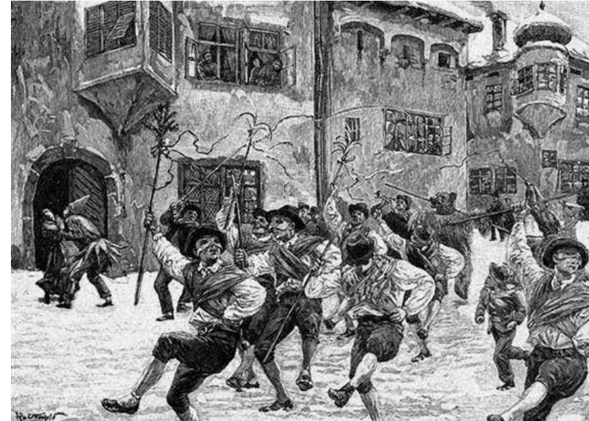
Ottenfeld Rudolf: Farsangi csörgettyűs táncz Matreiben (Az Osztrák-Magyar Monarchia írásban és képen. Tirol és Vorarlberg. 273. o.)

meg fehér ingbe és nadrágba öltözött s falábon tánczó bohócok, kik nélkül a Wipp-völgyben nem lehet el e menet.” 40