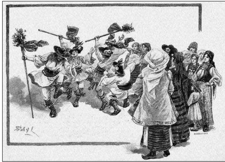
Pataky László: Kaluđer-tánc (Forrás: Az Osztrák-Magyar Monarchia írásban és képben. Magyarország 7. kötet. Délkelet Magyarország 427. osz.)

Helyenként hosszabb-rövidebb koreográfiai leírásokat is olvashatunk. A Felső-Ausztria népéről szóló fejezetben például a táncalkalmak helyét, térhasználatát (a zenészek, nézők és táncosok elhelyezkedését), a tánc (landler) menetét és mozgáskincsét (körüven lépő vonulás, kar alatt forgatások, páros keringések) bemutató részletesebb leírással találkozunk: