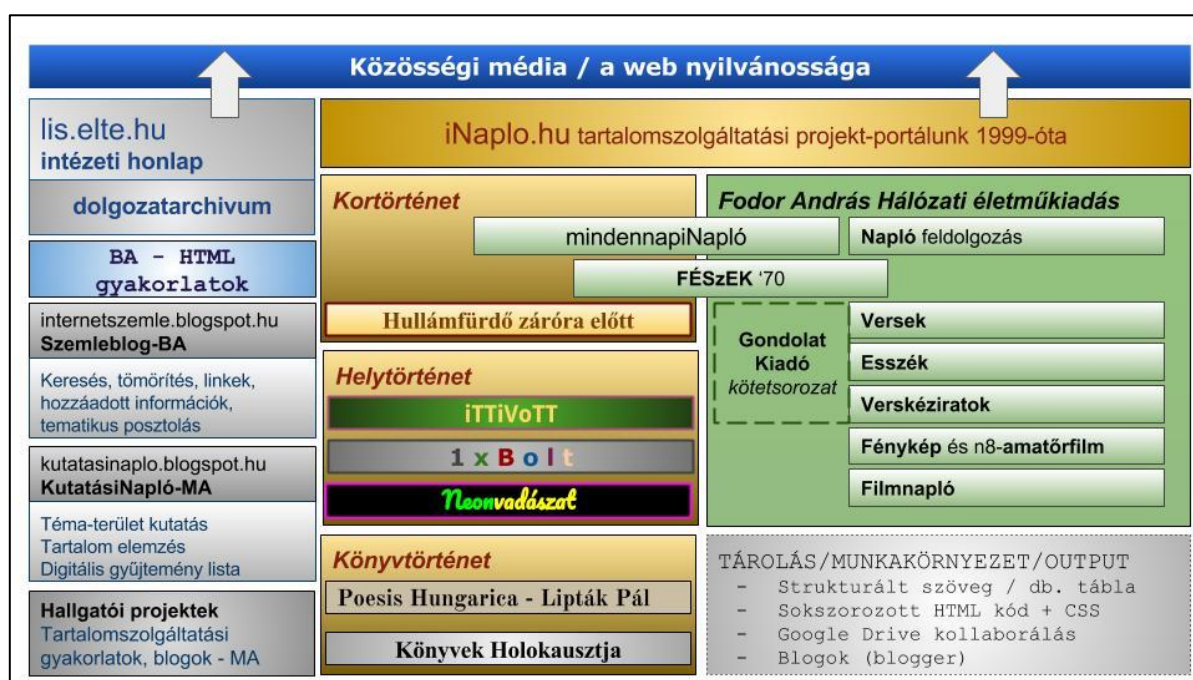
2. ábra. Közösségi média / a web nyilvánossága