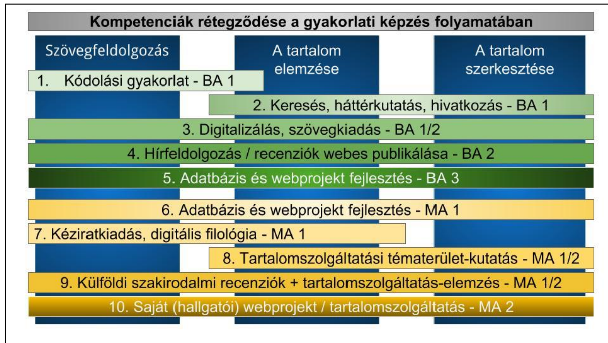
1. ábra. Kompetenciák rétegződése a gyakorlati képzés folyamatában

Hallgatóinknak kurzusról kurzusra új ismereteket, rétegzett képzést biztosítunk, amelyet az elektronikus dokumentumgyűjteményekkel kapcsolatos gyakorlatok is végigkísérnek. Az alap- és mesterszakos tanulmányok 6+4 féléve során tartalomfejlesztési műhelyünk az informatikus könyvtáros gyakorlati munka tíz, egymásra épülő, állandó szintjét biztosítja, kódolási gyakorlattól a komplex adatbázis-tervezési és -építési feladatokig (1. ábra).