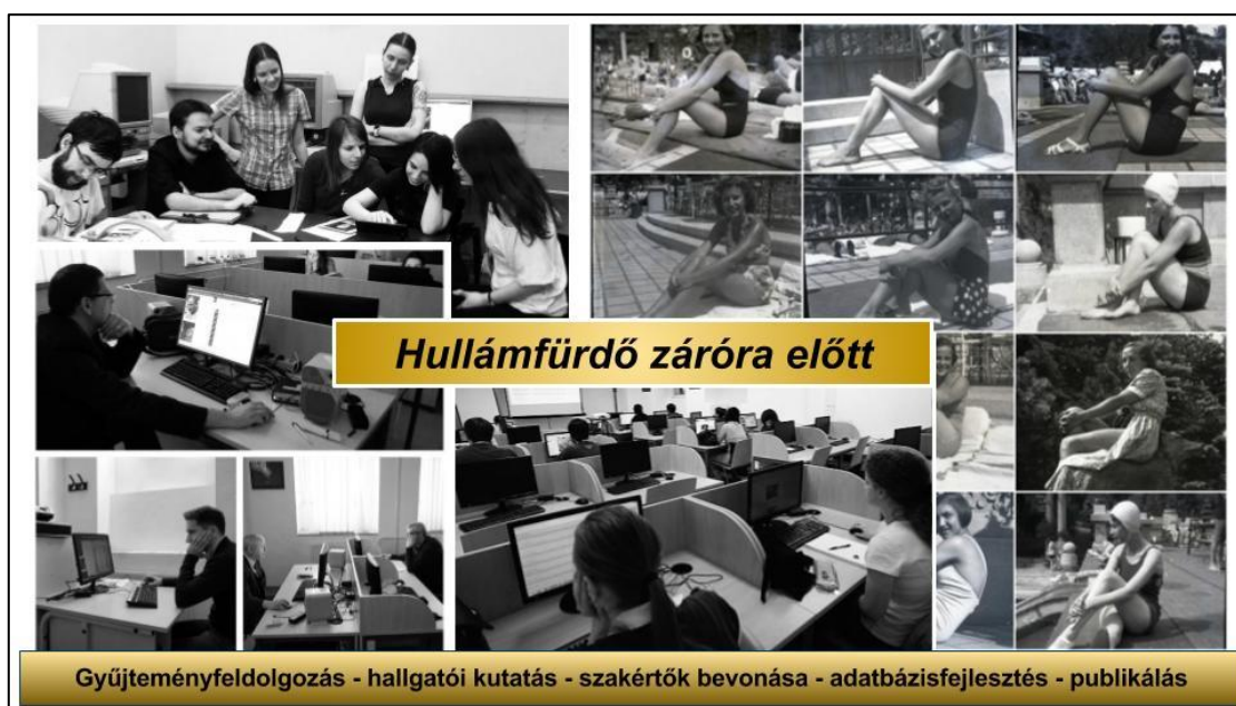
4. ábra. Hullámfürdő záróra előtt

Tartalomfejlesztő projektünkbe bevontunk szakértő történészeket, segítségükkel számos, korábban ismeretlennek tűnő fürdővendéget azonosítottunk. A projektben részt vevő hallgatókkal minden felismert személyről leírást készítettünk, linkeket kerestünk róluk.