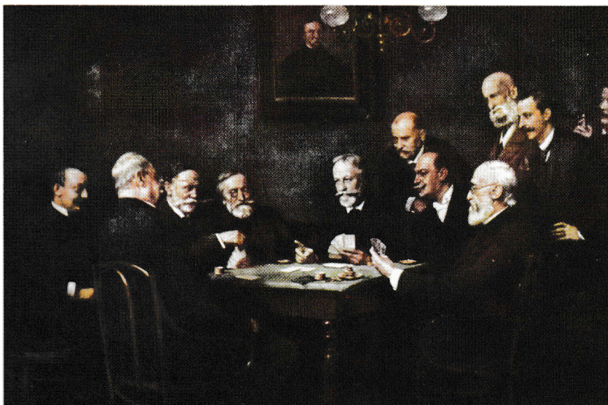
Történelmi tarokkparti (Ferraris Artúr festménye)

Arra szinte mindenki emlékszik, hogy Mikszáth A tót atyafiakkal és A jó palócokkal robbant be a magyar irodalomba, de azt már kevesebben tudják, hogy Mikszáth csak az 1881–1882-es években, azaz közel tíz évnyi fizikai, lelki és egzisztenciális megpróbáltatás után jutott a sikerhez. Pedig sóvárgó ambíció fűtötte és jóformán semmitől sem riadt vissza.