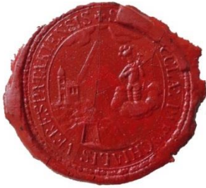
5. A verespataki plébánia pecsétjének viaszlenyomata, 1826