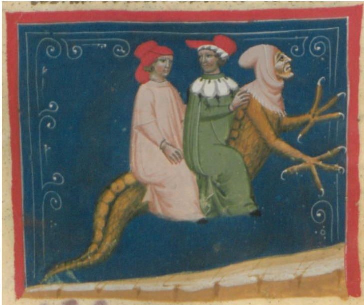
A fol. 15v lap alsó miniatúrája