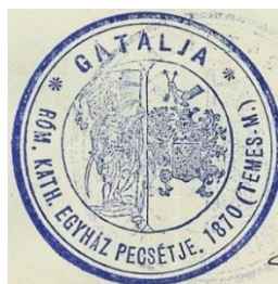
18. A gátaljai plébánia bélyegzőjének tuslenyomata, 1910