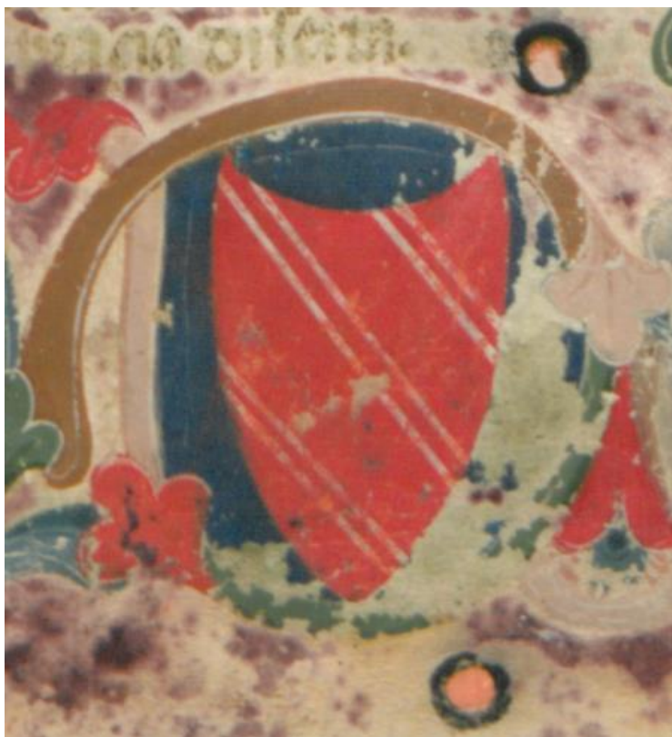
A Dante-kódex fol.1r lapalji címere ( Egyetemi Könyvtár )