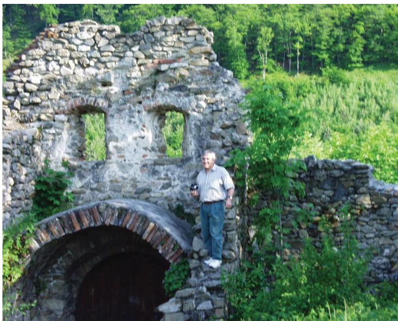
Erdélyi kirándulás – a kisdisznódi várban