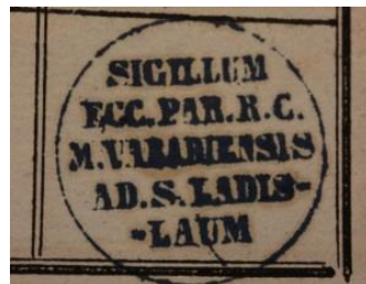
12. A Nagyvárad-újvárosi plébánia bélyegzőjének lenyomata, 1858