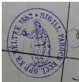
14. A krasznabélteki plébánia bélyegzőjének lenyomata, 1862