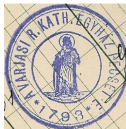
20. A varjasi plébánia bélyegzőjének tuslenyomata, 1910