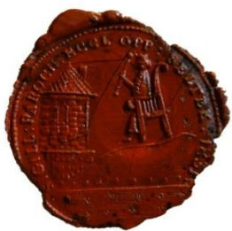
13. A krasznabélteki plébánia pecsét-nyomójának viaszlenyomata, 1831