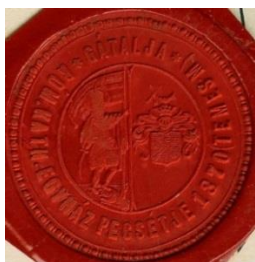
17. A gátaljai plébánia pecsétjének viaszlenyomata, 1910