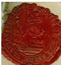
19. A varjasi plébánia pecsétjének viaszlenyomata, 1848