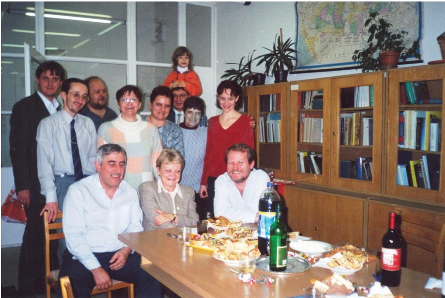
Karácsony az ELTE Levéltárban a Ludovika épületében (1998)