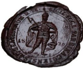
8. A mezőbikácsi plébánia pecsétjének viaszlenyomata, 1830 Nagyvárad – Újváros