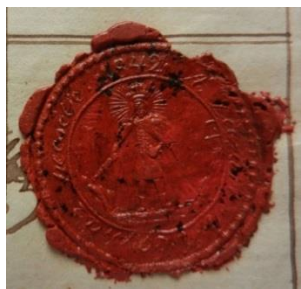
15. A lázári plébánia pecsétnyomójának viaszlenyomata, 1842