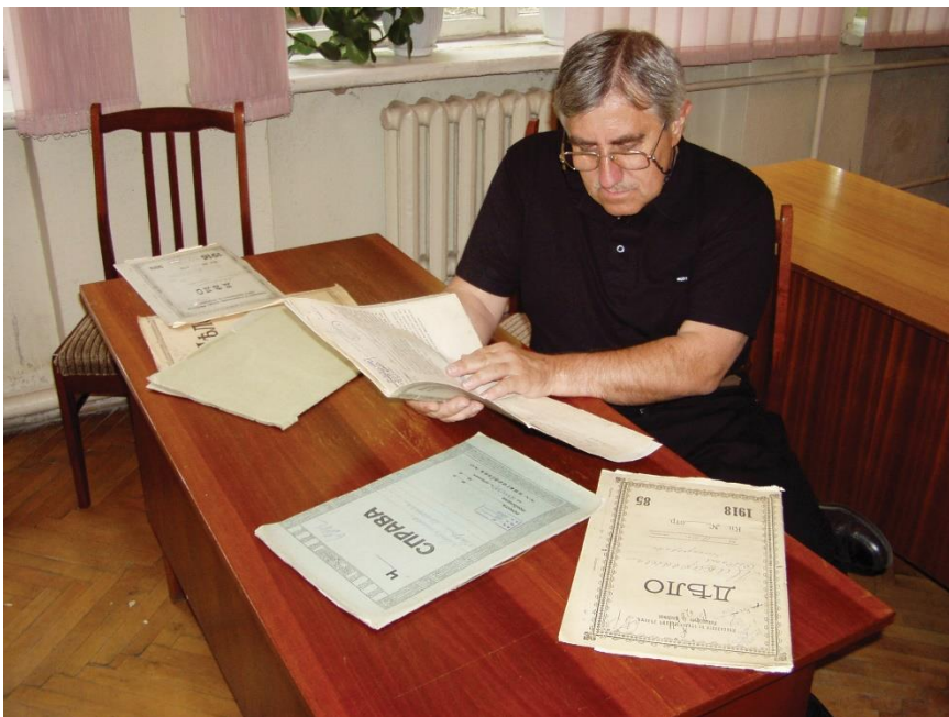
Levéltári kutatás Kijevben (2005)