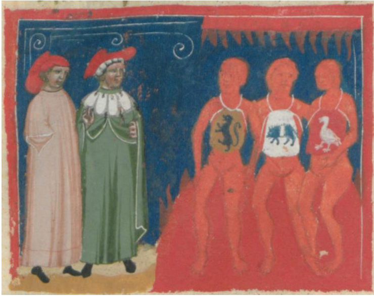
A fol. 15v felső részének ábrája