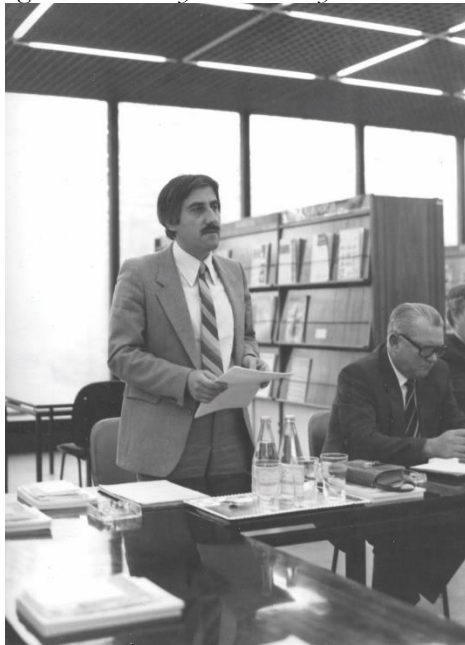
Előadás Miskolcon (1985)