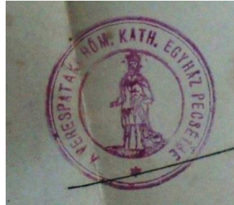
6. A verespataki plébánia bélyegzőlenyomata, 1912