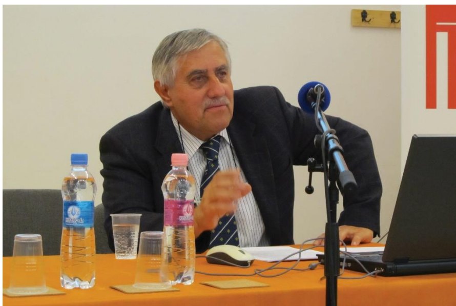
Előadás a jezsuita Párbeszéd Házában (2011)