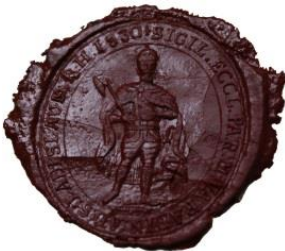
11. A Nagyvárad-újvárosi plébánia pecsétjének viaszlenyomata, 1830