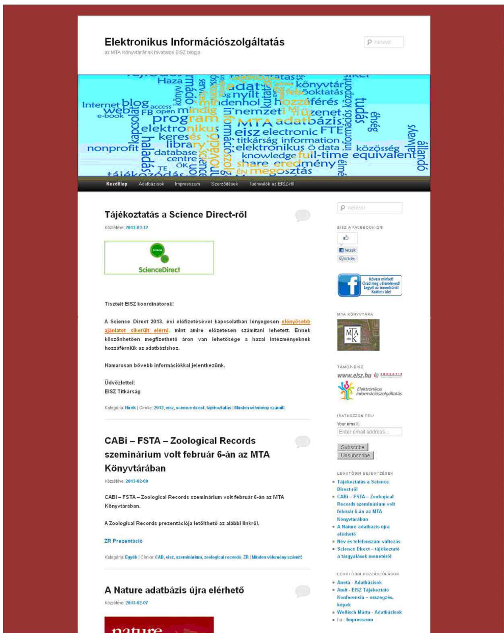
1. ábra EISZ-blog (Elérése: http://eisz.mtak.hu )

A terjesztést a blogon, illetve a meglévő e-mail kapcsolatokon keresztül végezzük. Naprakész tájékoztatás, újdonságok bemutatása, események, programok népszerűsítése közvetlen kommunikációval történik. Személyes kapcsolattartásra egyedi bejelentkezés alapján és az adatbázis-bemutatókon való részvétellel nyílik lehetőség. Fontos partnereink az intézményekben dolgozó EISZ-koordinátorok, akikkel szintén közvetlen, sok esetben személyes napi kapcsolatot tartunk fenn. Rendszeresen szervezünk oktatóprogramokat, bemutatókat, ezeket többnyire a szolgáltatók kezdeményezik, éppen úgy, mint az online webinarprogramokat. Az elmúlt évben nyolc alkalommal szerveztünk bemutatót, képzést. Természetesen intézményi igények alapján is van lehetőség bemutatók, oktatóprogramok szervezésére, a kiadói szórólapok, tájékoztatók továbbítására, felhasználókhöz való eljuttatására.