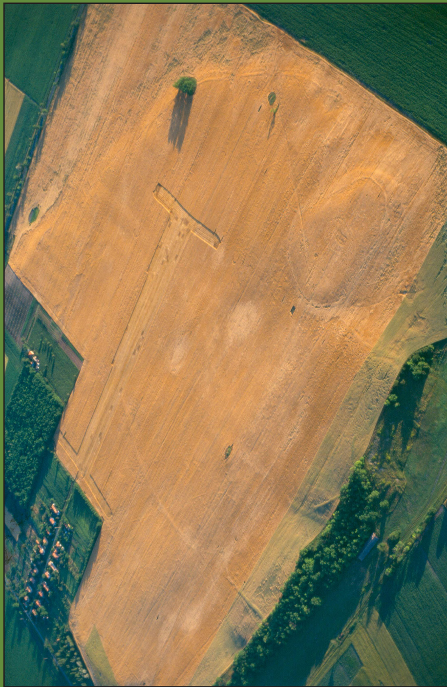
A Tételhegy, Otlo Braasch légi felvétele, 1997. Pécsi Légirégészeti Télika, Pécs