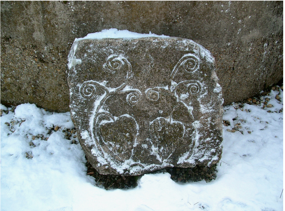
2. Római kori (?) kőfaragvány, Solt, Vécsey-kastély.