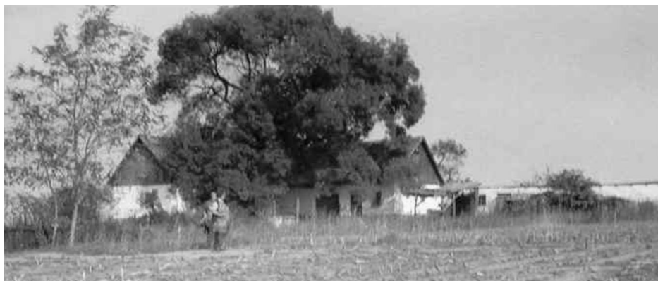
2. A Farkas-tanya a Tételhegy délnyugati peremén.