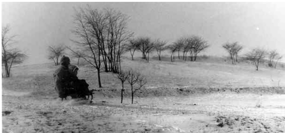
1. Szánkózók a Tételhegy északkeleti oldalán.