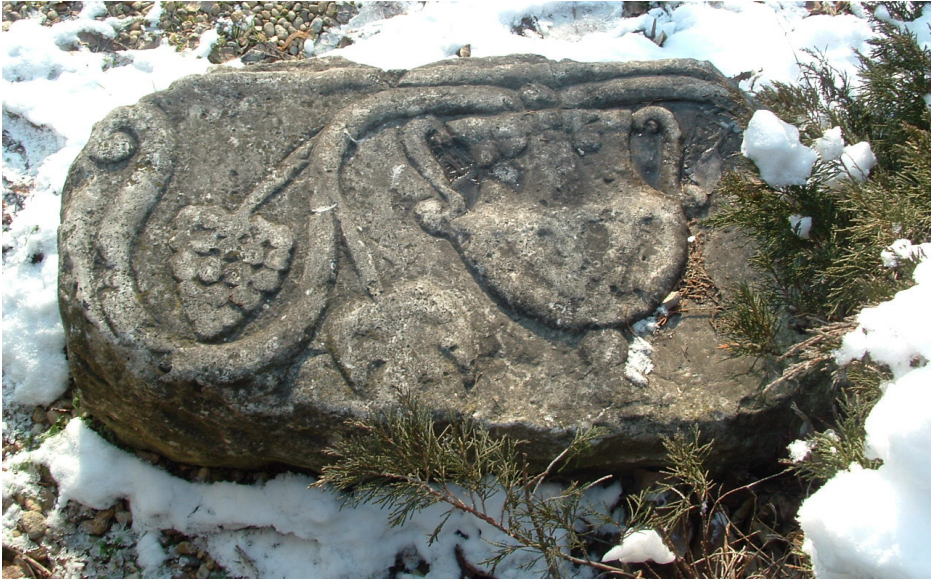
1. Római kori kőfaragvány, Solt, Vécsey-kastély.