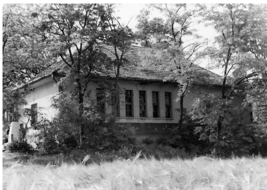
3. Az egykori iskola épülete a Tételhegy délkeleti részén.