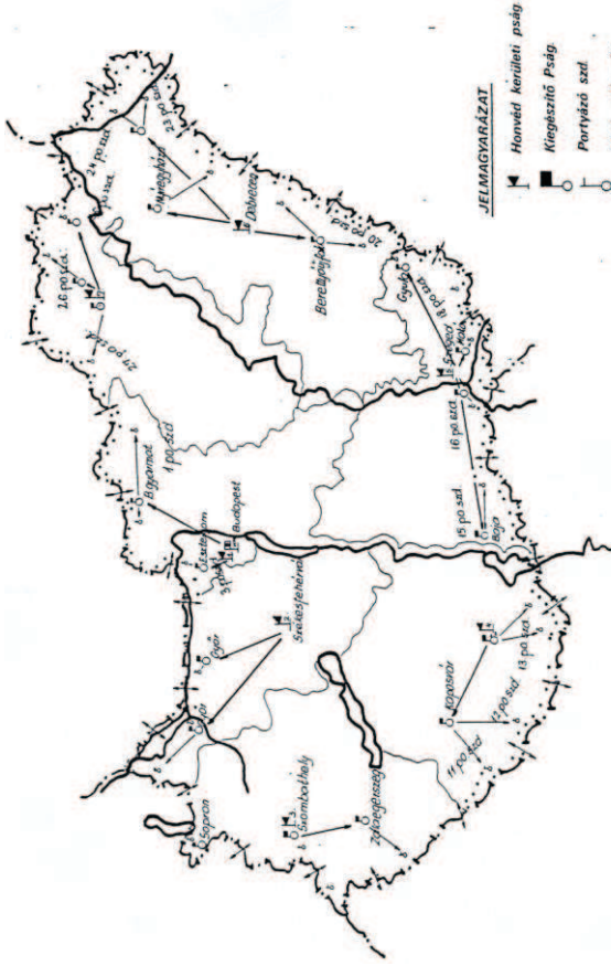
A Honvéd Határőrség diszlokációja 1945.

Forrás! GÁSPÁR László: A magyar határőrség szolgálati tevékenységében ható elvek érvényesítése és változásai 1945-től az 1980-as évek végéig . 4.sz. melléklet. Hadtudományi Kandidátusi Értekezés. (MTA) Kézirat. Budapest, 1996. 190 p. +46 melléklet.