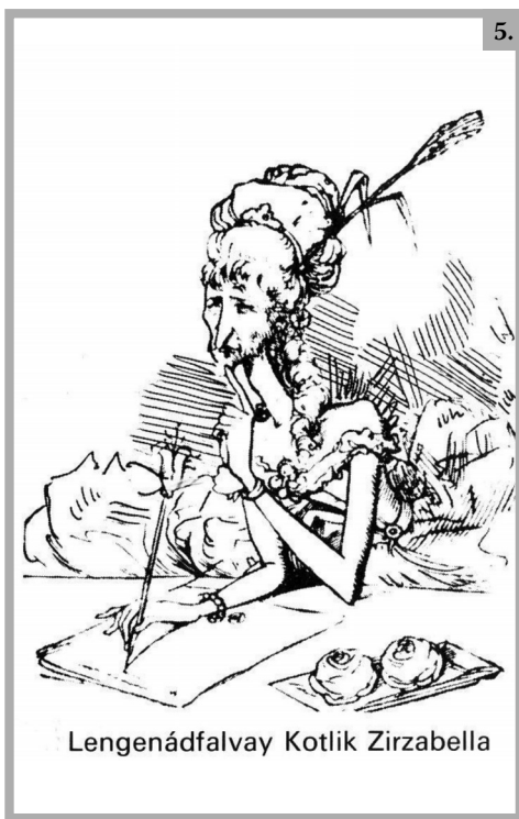
Lengénádfalvay Kotlik Zirzabella

A Borsszem Jankó gúnyos hangvételű „honleányi levelnek” megfogalmazója talán nem is gondolt arra, hogy a nőies tevékenységekkel miféle „férfias” cselekedeteket állított szembe: a háztartást vezető, anyai hivatását betöltő nőkkel szemben a cikk (és sok más, hasonló tartalmú írás és kép) szerint az italozó, káromkodó, háborúzó férfiakat ábrázolta. Az Uj Idők egy 1898-as, Faragó József által készített karikatúráján pedig még több „férfias” tevékenység közepette láthatjuk a nőt. Biliárdozik, iszik, parancsolgat és dohányzik, kártyázik, újságot olvas. Tulajdonképpen csak a szoknyája különböztetné meg a férfiktól, ha nem lenne mellén egy szopó kisgyermek. (6. kép 1678 )