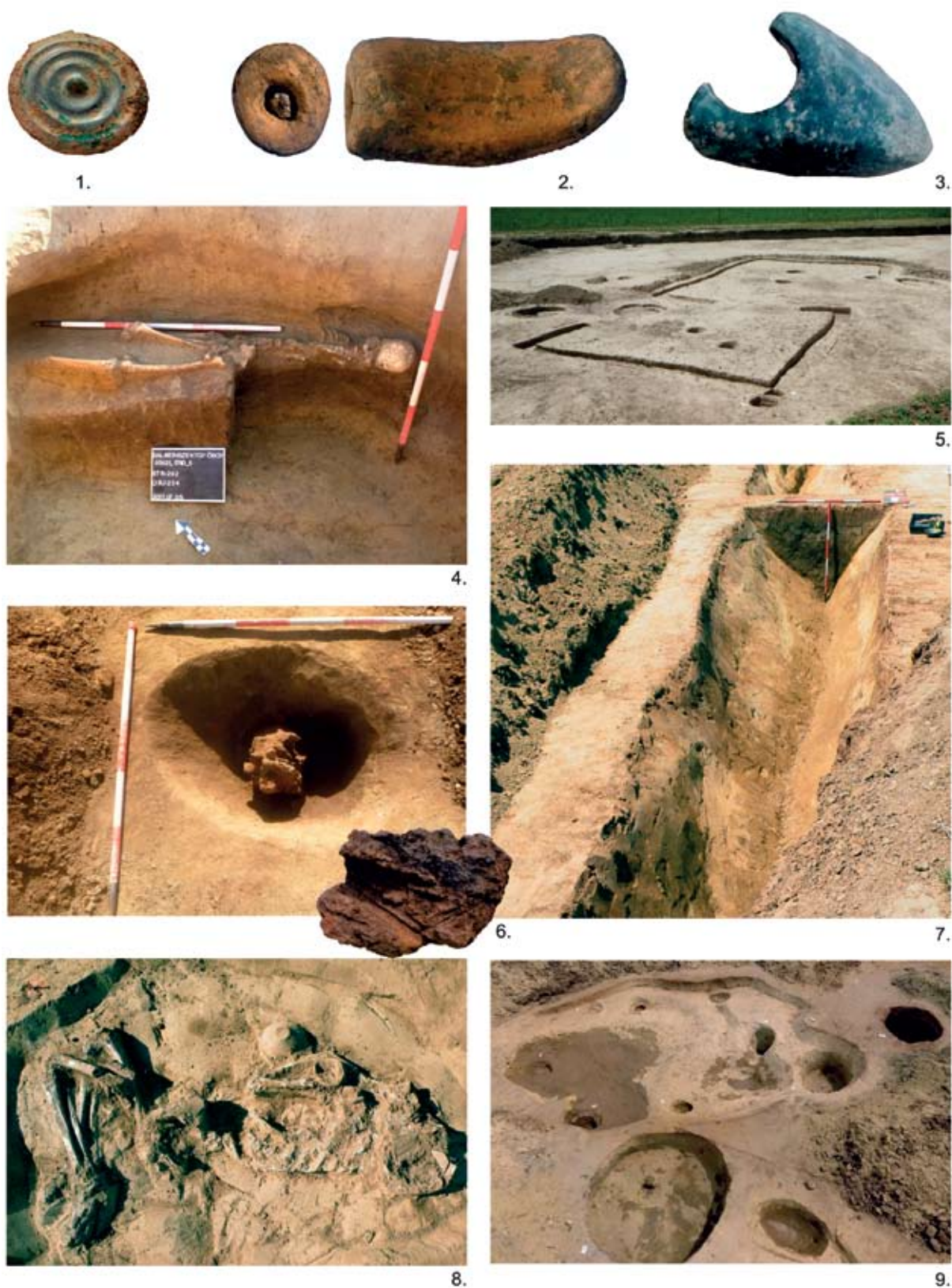
VII. tábla. 1-6. Balatonszengyörgy – Kocsmaházi-dűlő IV: 1. Bronzkori korongcsüngő. 2. Agyagtárgy. 3. Kőbaltatöredéke. 4. Áldozati temetkezés. 5-6. Középső rézkori alapárkos ház, és a közepén levő, égett anyaggal teli gödör. 7-9. Balatonszentgyörgy – Faluvégi-dűlő 2: 7-8. A lengyeli kultúra körárka (690. str.) és edénymellékletes sírja (707. str.) 9. Kisapostagi építmény vermekkel