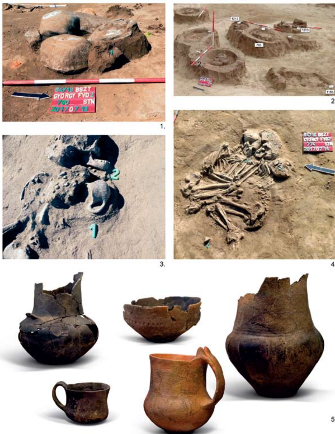
VIII. tábla. Balatonszentgyörgy – Faluvégi dűlő 2, a Badeni kultúra birtuális sírjai és sírkerámiája: 1. Kőpakolásos sír, 780. str. 2. Sírcsoport. 3. Az 1211. sír edénnyel és gyöngyökkel. 4. A 774. kettős sír. 5. Urnák, tál, kisbögre és korsó a temetkezési mellékletekből