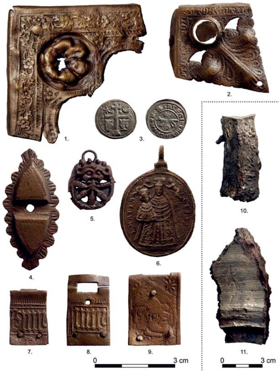
II. tábla. A bárdudvarnoki premontrei prépostság feltárásakor talált középkori leletek: 1-2., 7-9. könyvveretek és könyvcsatok, 3. szlavón dénár, 4. veret, 5. ruhakapocs, 6. újkori kegyérem, 10-11. harang darabjai