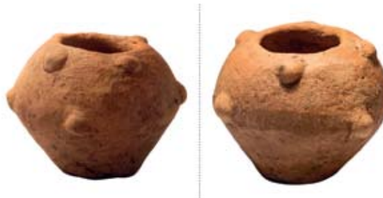
2. ábra. Balatonszentgyörgy – Szentkút: A Lengyeli kultúra edénykéje a 15. objektumból

került egy újabb, nagyobb részlete. Az őskori telepet nyugatról lezáró árokból számos kerámiatöredék került elő, így füles edények töredékei, csótalpas táltöredék és átfűrt agyagtárgy is. A telepen belüli objektumokban kevés leletanyag volt, de az árok melletti nagyobb gödrökből sok leletet gyűjtöttünk. Előkerült egy ép, bütykös kisedény (2. ábra), egy „miniatűr” edényke, szűrőedény aljtöredéke, egy hengeres agyagtárgy. Több festett edénytöredéket is találtunk valamint sok kovapattintéket és kőeszközt.