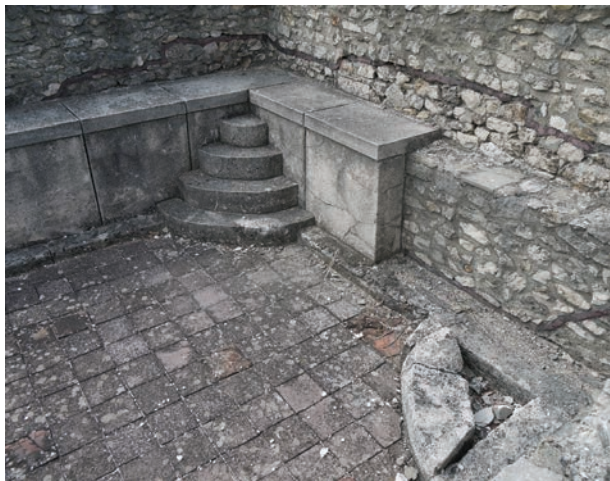
1. ábra. Aquincum, Kettős fürdő úszómedencéjének (natatio) részlete