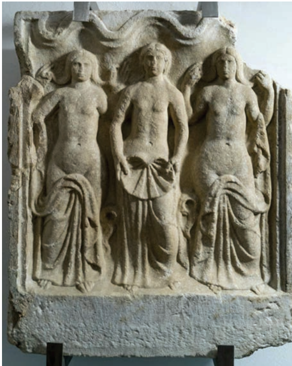
3. ábra. Három Nympha ábrázolása

Azonban fennmaradtak emlékeik Óbudán, 46 Badenben, Petronell és Deutsch-Altenburg között Carnuntumban, Kisigmádon, 47 Ó-Szőnyben (Brigetio), Dunaalmáson, Nyergesújfaluban (Crumerum), Kékkúton 48 és Szombathely (Savaria) környékén is. 49 Aquae lasae és Aquae Balissae/Balizae (ma: Daruvar, Horvátország) és Topusko területén is a gyógyforrásokhoz kapcsolódtak, gyakran különféle megszólításokkal illették őket, úgymint Salutares , Augustae vagy lasae . Aquae lasaeban Nymphaeum , egy kezdettől fogva a Nympháknak ajánlott szentély volt, melyet a 2. század folyamán a res publica Poetoviensium épített a fenséges Nymphák (Nymphae Augustae) tiszteletére. 50