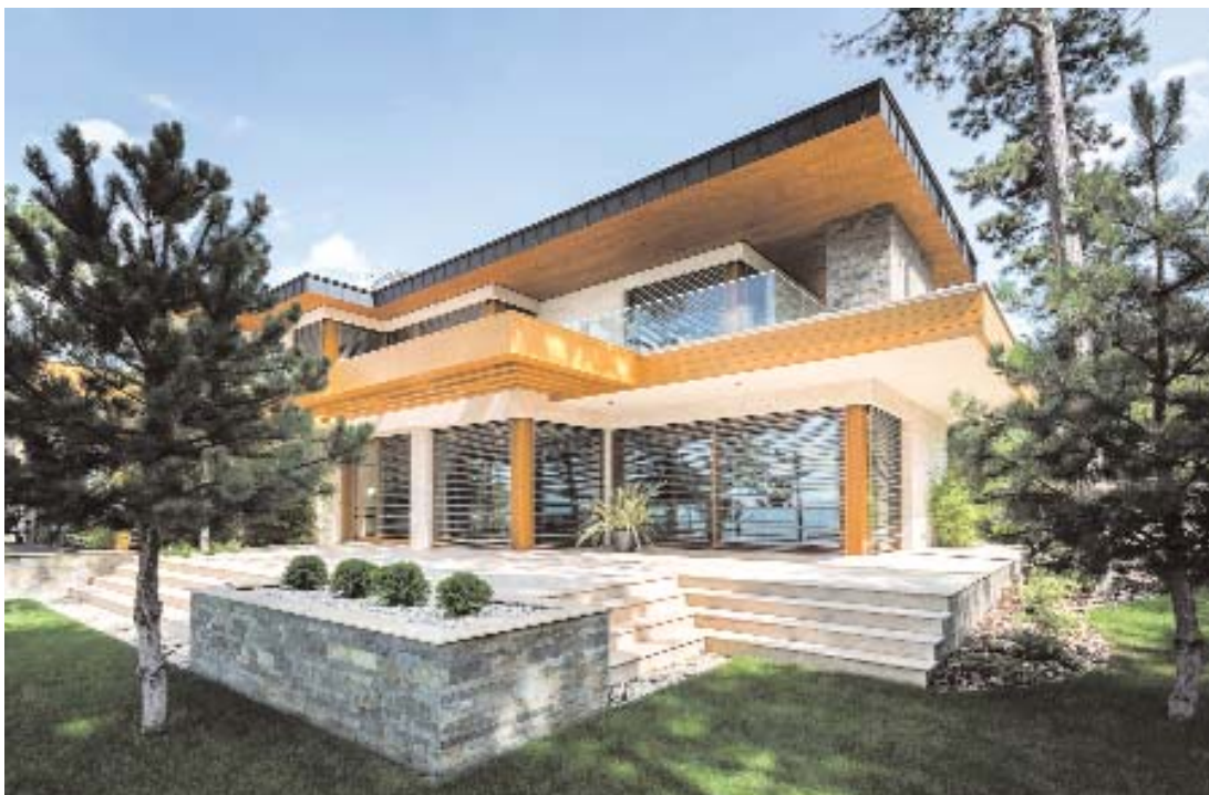
A déli part jellegzetes, telepített fenyveseibe ágyazott mediterrán tömegforma

Egyszerűség, játékoság és kísérletező formálás jellemezte a hatvanas évek nyaralóépítészetét. A nyaralás természetközeli felfogása ebben az időszakban artikulálódott legtisztábban. A forradalom utáni társadalmi konszolidációban egyre szélesebb rétegek jelentek meg a tóparton, akiknek egyre szűkebb telkeken, egyre kisebb