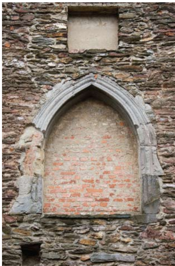
3. kép A kaputorony emeleti kápolnájának egykor a palota emeletéről nyíló, kőkeretes bejárata.

A toronyaljon át a palota belsejébe vezető, keskeny kapubejárat, amely az akkori járószintnél több lépcsőfokkal magasabbról nyílt, 15 csak a földszinti személyforgalmat szolgálta. A palotának ez az alsó szintje a hátsó északkeleti kis udvar felől szintén megközelíthető volt, de innen indult, s a belső fal mellett ve-