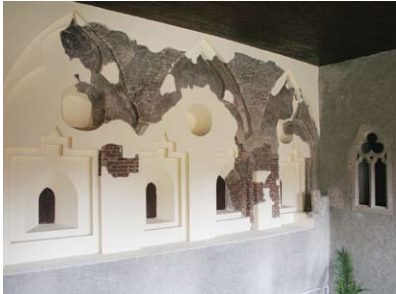
7. kép A palota díszes ablakcsoporttal kialakított, festett homlokzata a kaputorony nyugati falának részletével.

Rendkívül furcsa, hogy az északi palota homlokzatán (7. kép), a mai járószint fölött kb. 4,1 m magasan az emeleti falsík a földszintre képest részösen eltolódik, ami azt jelenti, hogy a két szint között, közvetlenül a torony mellett egy 45 cm széles padka alakul ki, amely nyugat felé folyamatosan elkeskenyedik, majd az északnyugati sarokban, a későbbi palotaszárny csatlakozásánál teljesen elfogy. Köpenyezésről nem lehet szó, hiszen középtájon a falszöveggel egy idős, földszinti résablak külső síkja és terméskő kávája szabályos kialakítású. 22 A jelenség a Kasper Sándor, majd Nagypál Judit által készített, később pedig Holl Imre kutatásaihoz kapcsolódó felmérései, illetve periodizációs rajzokon valószínűleg azért nem látszik egyértelműen, mert a későbbi eléépítések téglaköpenyfalait akkor még nem bontották el. Sedlmayr János rajzán szerepel ugyan, magyarázatát mégsem olvashatjuk sehol. 23 Ebből a szempontból lényeges, hogy a homlokzaton jelentkező vízszintes falsíkváltás éppen a palota és a torony északnyugati csatlakozásánál a legnagyobb (42 cm), ahol a középkori terméskő fal egészen biztosan kötésben épült a palota alsó szintjével. A különös megoldás ér-