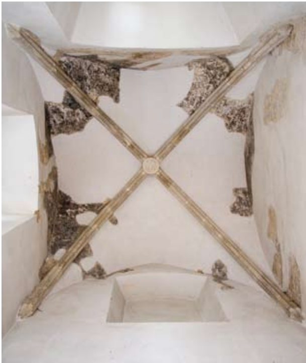
4. kép Az emeleti kápolna bordás keresztboltozata és középkori festésmaradványai.