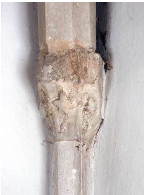
8. kép Másodlagos elhelyezésű, levéldíszes oszlopfejezet a kaputorony földszintjéről.

tetnek. Mai kopottságukra utalhat az a tény, hogy előkerült egy velük azonos kialakítású, de ma is jól látható részletformákkal megfaragott, további kis töredék. 39 Esetében egyértelműen virágról van szó, amelynek öt (vagy hat) szirma a hangsúlyos kerek közép-motívumból kiinduló, széles erek által tagolt. Mérete alapján a 10×11,5 cm nagyságú, stilizált virág ugyan nem törhetett le egy másik – a meglévő fejezetet alapul véve –, mindössze 22 cm magas, hiányzó sarokoszlopfőről, elképzelhető azonban, hogy egy ugyanabbe az összefüggésbe tartozó zárókő része volt. A kis töredék stílusát és részletformáit tekintve nem áll messze a felső szint in situ zárókövétől. Ugyan a levél- illetve virágformák különböznek, mégis mindkettőre jellemzőek az erőteljes középerék és figyelemre méltóak a fölül kopottságuk miatt inkább kis félgöm-