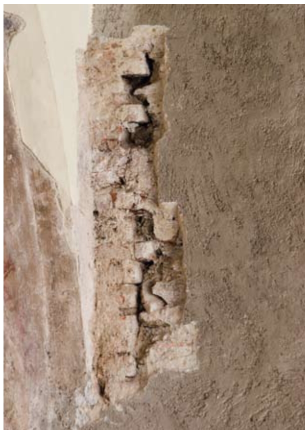
6. kép A palotaszárny és a kaputorony homlokzati falainak csatlakozása az emelet északnyugati sarkában.

A torony nyugati külső oldalhomlokzatát kisebb szakaszokon vizsgálva megállapítottuk, hogy mindkét