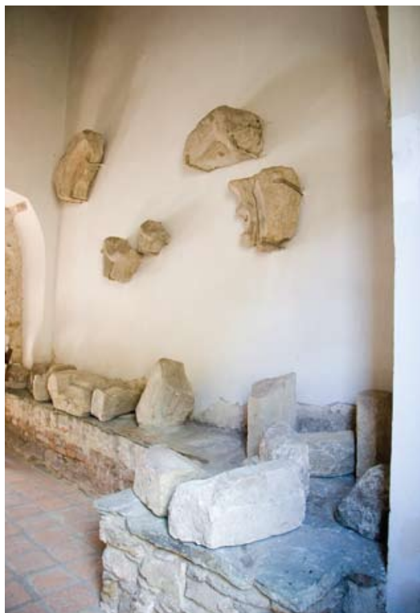
9. kép Középkori ülőpadka a kaputorony földszinti belső terében.

A fraknoi várban (Forchtenstein, Burgenland) a Nagymartoni (Mattersdorfer) grófok által az 1291. évi hainburgi békekötés után emelt vár öregtornyának alsó szintjén, amely alatt a hosszan a talajba lenyúló alapfalak 8 méter mély üreget rejtenek, három egymás melletti helyiség található. Egy valamikori lépcső érkező előtere, alacsony csúcsíves, kőkeretes bejárattal, egy keresztboltozattal fedett négyzetes tér, mellette pedig még egy keskenyebb másik, amely fölött dongaboltozat van. Az egyszer hornyolt bordák kerek zárókőben futnak össze, rajta valószínűleg az építető család címerállataként megjelenő sas látható. A bordák gazdagon faragott, felül sokszögű, alul kis fejcskékben végződő, szívd alakú és hullámzó felületű, erőteljesen megmozgatott szegélyű, nagyobb levelekkel díszített konzolokra érkeznek. Stílusuk alapján a kutatás a boltozattal együtt a térkialakítást is a 14. század első harmadára keltezi. A tér nyugati és északi falában téglalap formájú, kisebb kőkeretes nyílások vannak, ezek valószínűleg szekrényként szolgáltak. Számunkra különösen érdekes a melléktérnek nevezett keskenyebb helyiség. Itt ugyanis a falak mentén velük együtt készült terméskő padkák húzódnak végig. Keleti irányba egy magasra helyezett, befalazott ablak néz, ame-