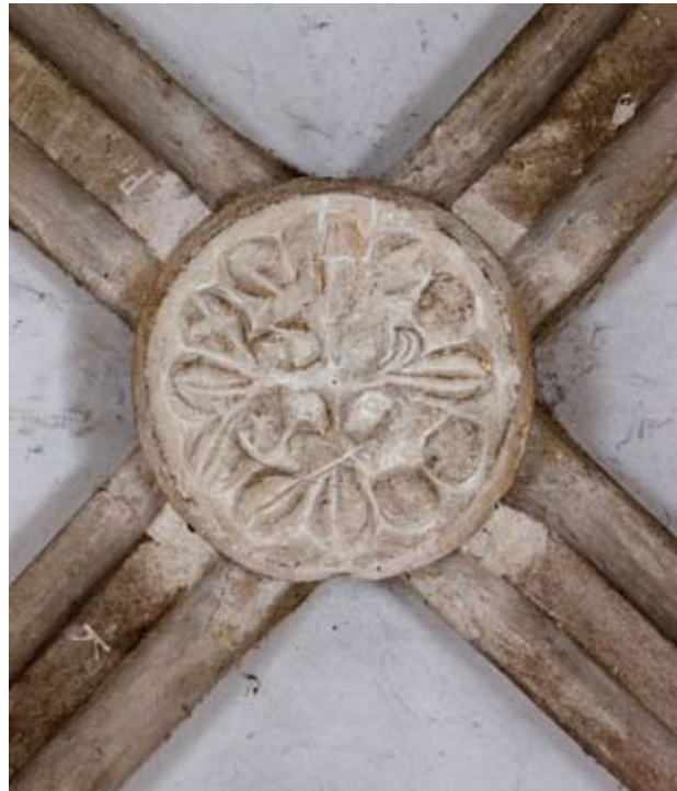
5. kép Az emeleti kápolna faragott boltozati záróköve. Fotó: Hack Róbert, 2011. (KÖH Fotótár)

zetett fölfelé az a lépcső is, amelynek segítségével az emeleti lakóterekbe lehetett jutni. 16 Egy 1962-ből fennmaradt kutatási fénykép 17 tanúbizonysága szerint a kapualjként működő helyiség falai mentén, a nyugati oldalon a belső átjáró nyílás mellé befordított, felül két utólagos téglasorral megemelt, terméskő padkák húzódtak. A ma is meglévő padkákhoz tartozó, Holl Imre által megtalált téglapadló 18 szintje viszont egy lépcsőfokkal mélyebben volt, mint az udvari bejárat küszöbszintje. Ehhez igazodott a belső nyílás, amely a felmérési rajz és fénykép szerint 19 nem lehetett szélesebb 180 cm-nél, kőkerete, s bizonyára nyílászáró szerkezete sem volt.