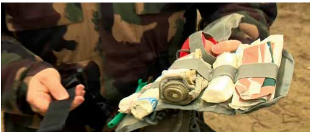
1. ábra. IFAK-csomag

A végtag súlyos vérzése esetén szorítókötés felhelyezése indokolt CAT-tel (Combat Application Tourniquet) vagy izraeli kötszerrel. A végtag felső harmadában egycsontos alapon a ruhára kell szorítani a vérzés megszűnéséig. Cson-