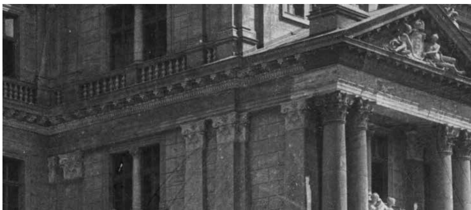
3. ábra. A homlokzat eltérő anyaghasználatát jelző színelkülönbségek. Fotó: Klösz György, 1895 körül. Forrás: Fővárosi Szabó Ervin Könyvtár – Budapest Gyűjtemény, ltsz.: 001044

Az épület külső homlokzatáról Klösz György által 1895 körül készített fényképfelvételen feltűnő, hogy az egyes épülettagezatok színe, tónusa eltért egymástól. A homlokzat anyaghasználatát tekintve döntően vakolt felületekkel bírt, de némely épületelemeket, például a szabadon álló kompozitfejezetes oszlopokat, illetve a rájuk támaszkodó párkányszakaszokat mészkőből faragtak ki, míg más, apróbb díszek és az allegorikus szobrok a Matscheko–Schrödl-féle műkőből készültek – ez okozza az eltérést (3. ábra).