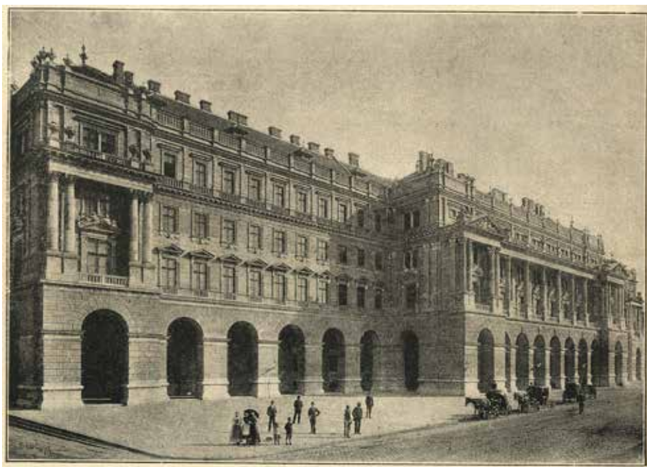
4. ábra. Az épületet eredeti állapotában mutató egyetlen ismert kép, melyen még valamennyi dísz látható.

ból világosan látszik, hogy miközben a parlamenti ellenzék az épületen való spórolást tekintette elsődleges szempontnak, addig a megvalósulását követően a kritikus közönség csak az addig nem látott nagyságú hivatali épület számukra riasztónak ható méretét és tömörszerűségét, viszonylagos egyszerűségét vette észre. Ugyanakkor Ferenc József 1890 nyarán az Országház építkezésén tett látogatásakor dicsérettel illette az épületet. 40