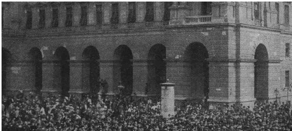
5. ábra. A rossz állapotú homlokzat részlete. Forrás: Vasárnapi Ujság 52 (1905. szeptember 24.) 39. 620