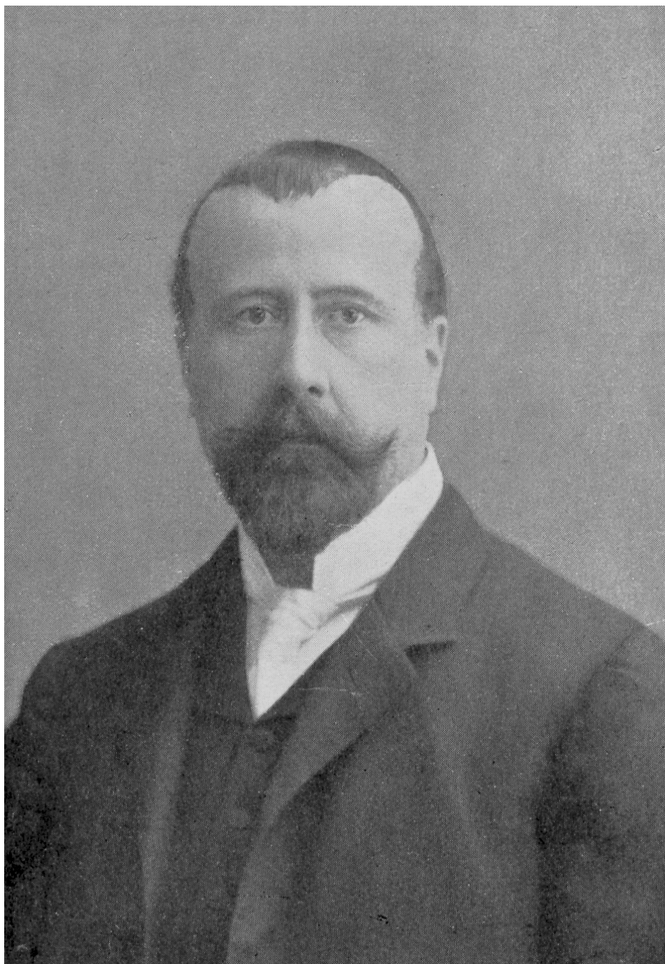
6. ábra. Istvánffi Gyula, a Központi Szőlészeti Kísérleti Állomás és Ampelológiai Intézet első igazgatója.