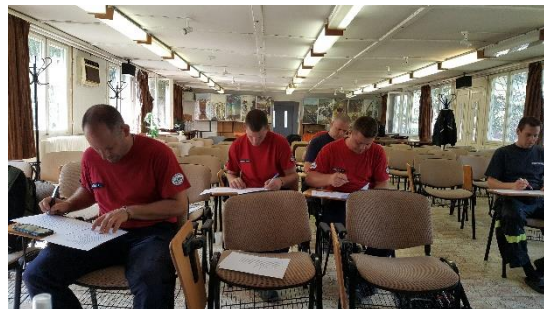
3. ábra A HUNOR Mentőszervezet kötéletechnikai mentési alegységének tagjai a felmérés – az állítások rendezése – közben