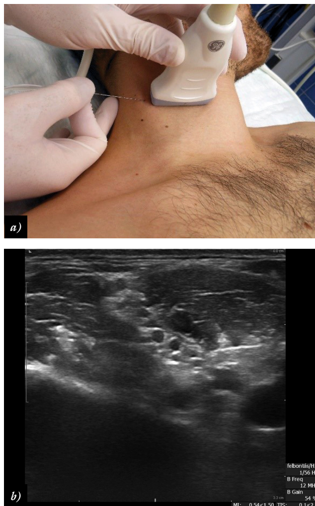
1. ábra a) Vizualizáció és az idegblokád kivitelezése UH segítségével b) A képernyőn megjelenő idegképlet (plexus brachialis)

melyeket nem ismerhetünk fel vizuális kontroll nélkül. Az UH alkalmazása lehetővé tette az anatómiai képletek – ideg- és érstruktúrák, egyéb viszonyítási pontok – vizualizációját, elősegítette, hogy a gyógyszeradagolás pontosan a kívánt helyre történjen, és megkönnyítette a variációk felismerését, ami a sikerarány jelentős javulásához vezetett. A RA és a posztoperatív fájdalomcsillapítás összefüggésének koncepciója teret nyert a mindennapokban, a PIB-okat tudatosan kezdték alkalmazni a műtét utáni fájdalmak csökkentésére és kivédésére. Az előnyös hatások és a kedvező megfigyelések hatására az 1998-tól elindult fájdalomcsillapítás multimodális megközelítésének koncepciója a műtéti fájdalomcsillapításban is teret nyert. A műtét utáni fájdalmak krónikussá válásának tendenciáját jelentős mértékben sikerült megfékezni az alkalmazott RA-technikákkal, ez vezetett annak felismeréséhez, hogy a műtét utáni krónikus fájdalmak megelőzhetők, így a preventív analgesia fogalma a 2010-es évek második felében széles körben elterjedt.