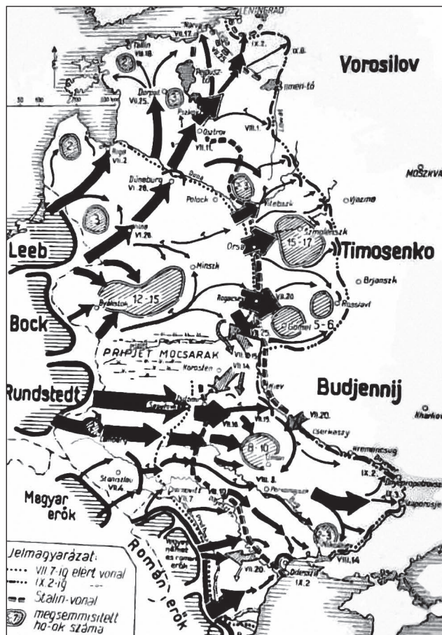
18. ábra. Az 1941. 10. 2-ig kialakult helyzet

val rendelkeztek a nagyszámú javításra váró technika miatt.