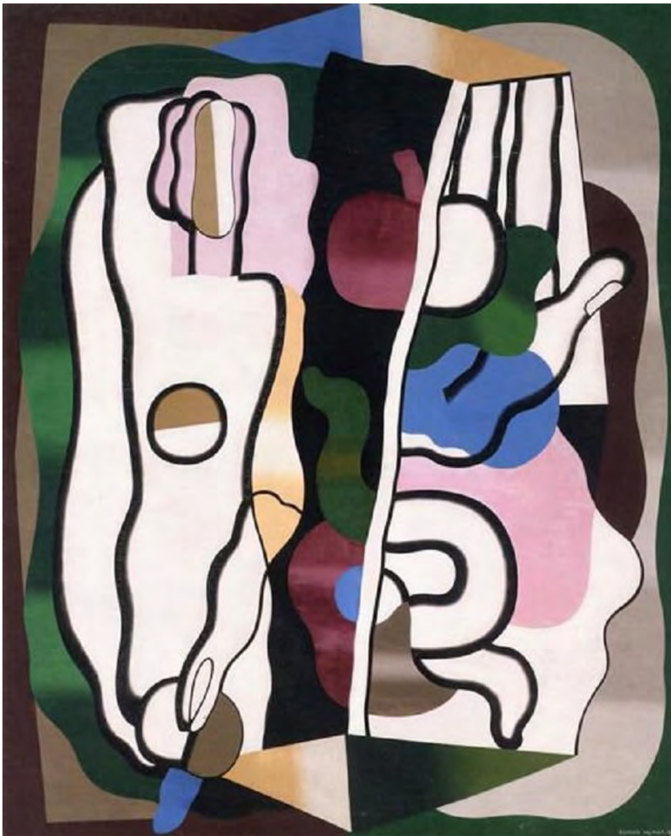
A frontgenerációk és a formátlanság kora: az utópia kísértése