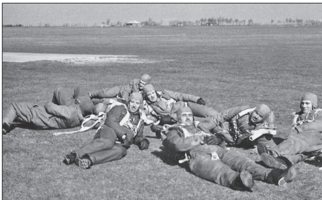
3. ábra. A Magyar Királyi Honvédség ejtőernyőskatonái a pápai repülőtéren, a kiképzések közti pihenőben

csoport feladata a Testnevelési Szaktanfolyam által megkezdett út folytatása, a magyar katonai ejtőernyőzés elméleti és gyakorlati alapjainak lefektetése volt. 15