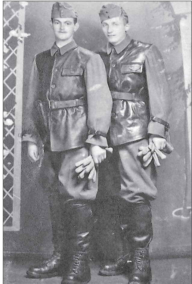
16. ábra. A II. ejtőernyős zászlóalj katonái 1945 elején, Pápan

Fontos megemlíteni az ejtőernyős alakulat légi szállító képességének utolsó megjelenését, az 1944. szeptember 26–27-én, Nagyváradon végrehajtott deszantolást, amelynek során új, FIAT G. 12-es szállító repülőgépeken egy