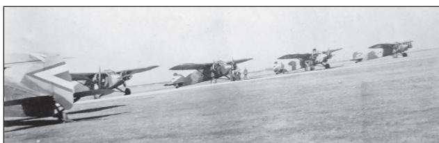
5. ábra. Caproni Ca.101-es repülőgépek Pápán

Az 1939-es év számos nagy változást tartogatott az ejtőernyősök számára. Nagy előrelépés volt a keret századdá alakulása, és 1939. október 1-jétől a légierő kötelékébe történt felvétele. 22 Az ejtőernyős alakulat anyagi-technikai ellátását a soproni 4/III. gyalogzászlóalj kapta feladatul. 23 Emellett az alakulat 1939. október 1-én Szombathelyről Pápára diszlokált, amiben nagy szerepe volt a frissen megüült pápai huszárlaktanya és a pápai repülőtér elhelyezkedésének is. 24