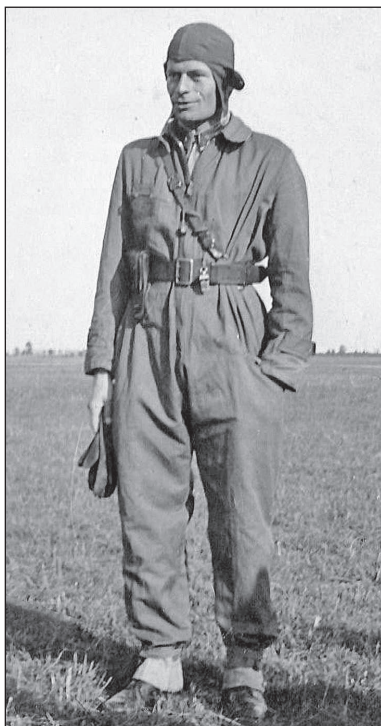
6. ábra. Ejtőernyős zászlós 1939M egybeszabott ugróruhában és fejkendővel

Az új ugróruha mellett új ejtőernyő, a Hehs Ákos mérnök százados által