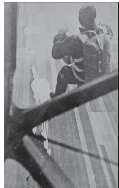
4. ábra. Ejtőernyős kötélkugrás

A Szombathelyen maradt leendő ejtőernyős tisztek bekötött ugrására 1000 méter magasságban, két hullámban került sor német Heinecke és olasz Salvator ejtőernyőkkel. Az első négy ugró közül ketten földet éréskor lábukat tör-