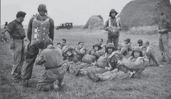
8. ábra. Ejtőernyősök ugrás előtt. Jól látható a kettős ejtőernyőrendszer, valamint a bőr védősisak is a gyakorlóterepen

szágok katonái jellemzően csupán egyetlen ejtőernyővel hajtották végre ugrásaikat. 28