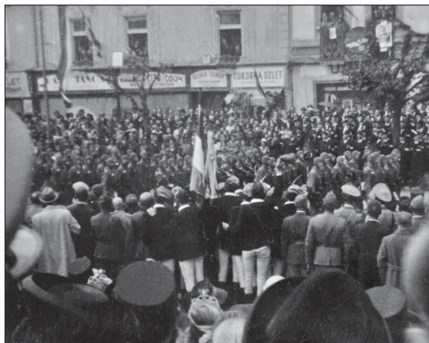
11. ábra. Ejtőernyősök kolozsvári díszmenete

Az ejtőernyős alakulatot 1940 augusztusában zászlóaljja bővítették. 35 Az alakulat propagandisztikus okokból részt vett Észak-Erdély visszacsatolásában, ahol az 1940. szeptember 15-i kolozsvári díszmenetben ejtőernyős ugróruhában vonultak fel, nagy feltűnést keltve. 36 A gyalogsági egyenruhától eltérő ejtőernyős ugróruha mellett, az 1940-ben rendszeresített ejtőernyős csapatjelvény is megkülönböztette a pápai ejtőernyősöket a többi csapatnem katonáitól.