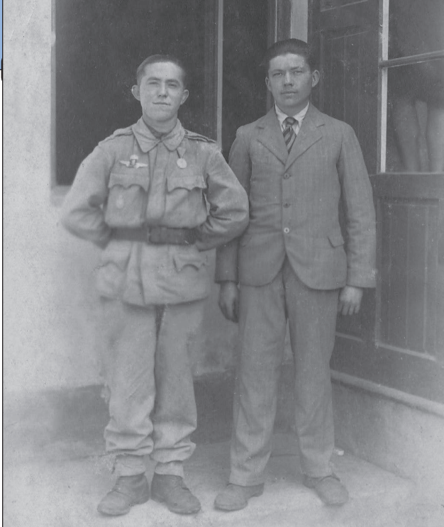
12. ábra. Büszke ejtőernyős nyári gyakorlóruhában, mellén ejtőernyős csapatjelvényvel és az erdélyi bevonulás emlékérmével

várni kellett. Bertalan őrnagy a társadalom elismerő támogatása ellenére még mindig nehéz helyzetben volt, amikor alakulata erejéit kellett bizonyítania a Honvédelmi Minisztérium felé, hiszen több sikeres bemutatón, az erdélyi bevonuláson és emberei kiemelkedő morálján kívül, más kézzel fogható eredményt nem tudott felmutatni, míg a német ejtőernyős alakulatok 1940-ben már kivették részüket a dániai, norvégiai, hollandiai és belgiami harcokból, bizonyítva az ejtőernyős koncepció létjogosultságát és a saját felkészültségüket is. 38