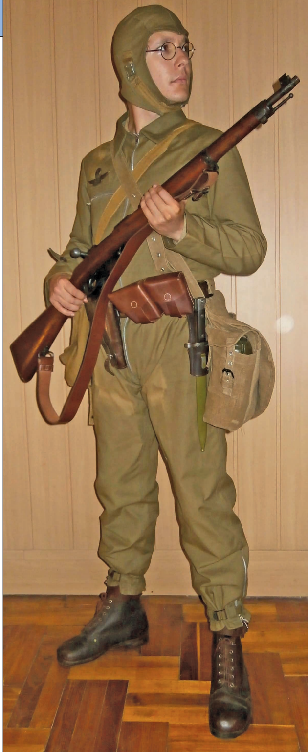
7. ábra. II. világháborús ejtőernyős hagyományörző teljes felszerelésben

tervezett 39M H Gy. kettős gyakorló ejtőernyőt is rendszerítették az addig használt olasz (Salvator), német (Heinecke és Schröder), valamint az angol-amerikai (Irvin) ejtőernyők helyett. 26 Az új, magyar tervezésű és hazai gyártású ejtőernyő bekötött ugrások és kézi kioldású nyitás, úgynevezett zuhanóugrás végrehajtására is alkalmas volt, így optimális eszköze volt a tömeges ledobásra és kis létszámú diverzáns feladatokra egyaránt felkészített ejtőernyős alakulatnak. 27 Az ejtőernyő-rendszer egy háternyőből és egy, az ugró hasára felszerelt mentőernyőből állt, így üzembiztonság tekintetében megelőzte az angol, vagy német ejtőernyősök hasonló eszközeit, hiszen a fenti or-