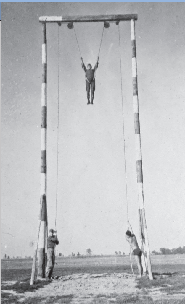
15. ábra. Ejtőernyős katona kiképzése a „bitón”, azaz földi ejtőernyős-gyakoroltató berendezésen

túlpárti hídfőt. 51 Ezt követően az ejtőernyős harccsoport tagjai a Sándor-csoport alárendeltségében harcoltak, amely egészen április 15-ig tartózkodott a hadműveleti területen. 52