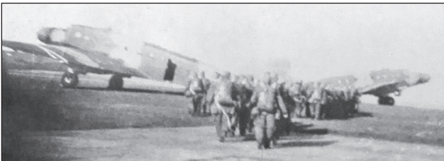
13. ábra. Ejtőernyősök beszállása SM.75-ös repülőgépekbe