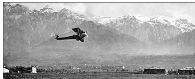
8. ábra. Egy „Brandt” startja a feltrei repterről