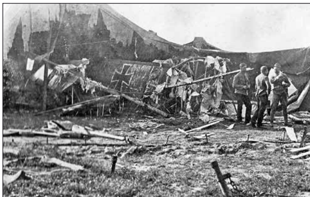
10. ábra. A feltrei reptér az 1918. május 25-i bombatámadás után

Ezt erősíti az a tény is, hogy nem szerepelt a század későbbi állománytábláiban sem.