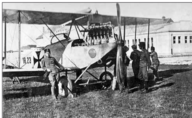
2. ábra. Willwerth a 18.23 számú Lohner C.I-es iskolagépnek támaszkodva, a wiener neustadti repülőtéren

test alárendeltségébe tartozott. Willwerth 1917. május 1-ig küzdött az 5. gyalogezred kötelékében szakasz-, majd századparancsnokként, ezt követően pedig zászlóalj és ezred segéd-tisztként szolgált. Egysége 1914-ben részt vett a komarowí, a lemberg-rarawuskai csatákban, valamint a San folyó menti harcokban és a krakkói ütközetben – ez utóbbiaknál már inkább a XIV., és helyenként a XVII. hadtesttel – komoly veszteségeket szenvedve. A decemberi offenzíva során még előrehatoltak egészen a Dunajec partjáiig, 1917 januárjában azonban az 5. gyalogezredet átirányították Bukovinába, a 7. hadsereghez. Jelen írás keretei nem teszik le-