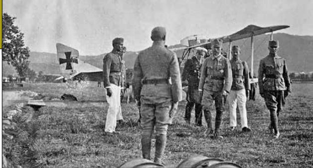
3. ábra. József Ferdinánd főherceg látogatása a Flik 32-nél 1917. augusztus elején

Neustadtban, a repülőtisztai iskolában (Fliegeroffizierschule). A képzést követően a Flik 32-eshez 4 osztották be, ahová 1917. július 18-án érkezett meg. A Richard Hübner százados vezetése alatt álló repülőalakulat az Isonzó-hadsereg alárendeltségében tevékenykedett és a Wippach-völgyben (ma: Vipava folyó völgye, Szlovénia) fekvő St. Veit (ma: Podnanos, Szlovénia) repülőterén állomásozott két másik repülőszázaddal. Az egység általános felderítő feladatokat látott el, amihez a kiváló Hansa-Brandenburg C.I típusú repülőgépeket használták. Ebből június 30-án 6 bevethető példány állt rendelkezésükre, a következő hónapban pedig már 1 Hansa-Brandenburg D.I típusú vadászgép is csatlakozott a felderítőkhöz. 5