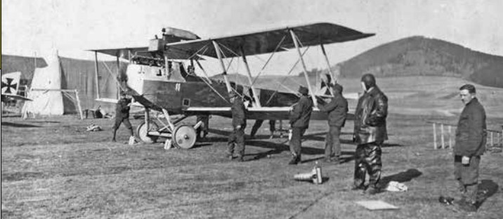
6. ábra. Motorpróba a Flik 39/D egyik Hansa-Brandenburg C.I-es felderítógépén