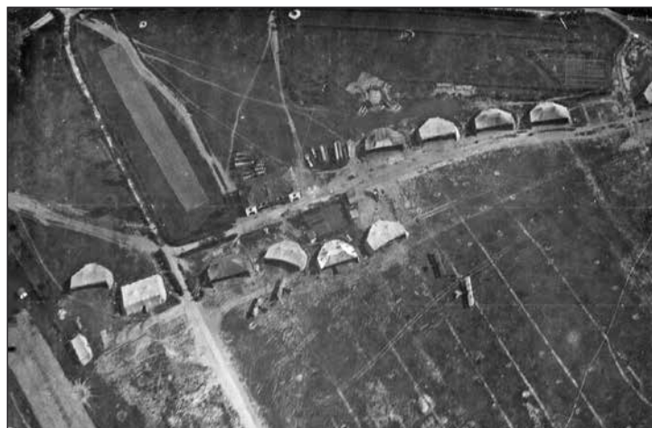
5. ábra. A feltrei repülőter felülnézetből