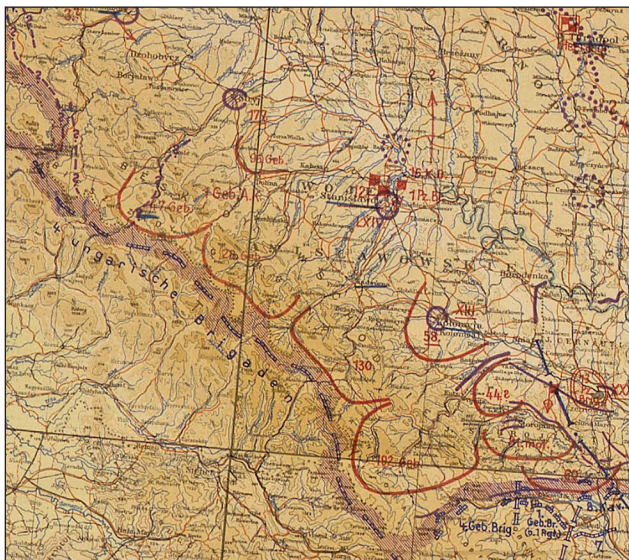
3. ábra. A magyar csapatok helyzete a műveletek megkezdése előtt, 1941. június 26-án. (Részlet egy német helyzetterképből)

A gyorscsapatok zöme május elején tért vissza béke helyőrségeikbe.