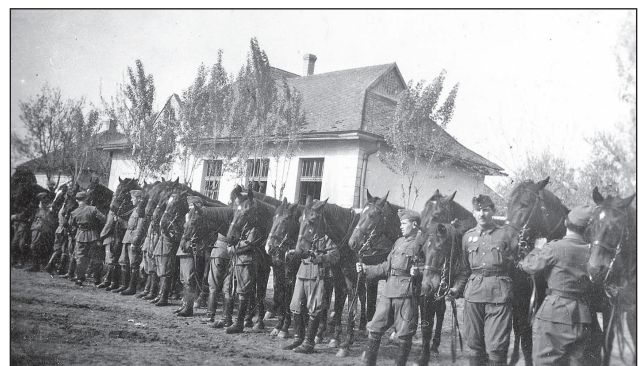
2. ábra. Lovak szemlére való felvezetése

Ezek végrehajtásába szült bele az 1941 áprilisában végrehajtott délvidéki hadművelet ezért a hadműveletet még a régi szervezettel hajtották végre (így voltak harcocsik még a felderítő-zászlóalj állományában).