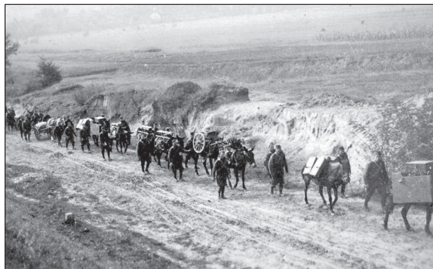
6. ábra. Hegyitüzérség előrevonása málházott löveganyaggal

A június 22–25. közötti időszakban a határ mentén szétbontakozott 8. határvadász és az 1. hegyi dandárt, bevezették a határon túli területek hézag nélküli megfigyelését, minden ellenségeskedés kezdeményezésétől tartózkodtak, de készen álltak arra, hogy minden orosz kezdeményezést a legerélyesebben visszautasítsanak. 24 (A magyar „visszautasítási”, azaz ellentámadási készségre igen nagy szükség volt, mivel – amint arra dr. Szabó Péter alezredes és