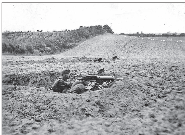
9. ábra. Határbiztosítás. Géppuskás raj tüzelőállásban

A bal szárnyon, a 8. határadászdandár parancsnoka vezetésével megalakult az úgynevezett „Rakovszky-cso-