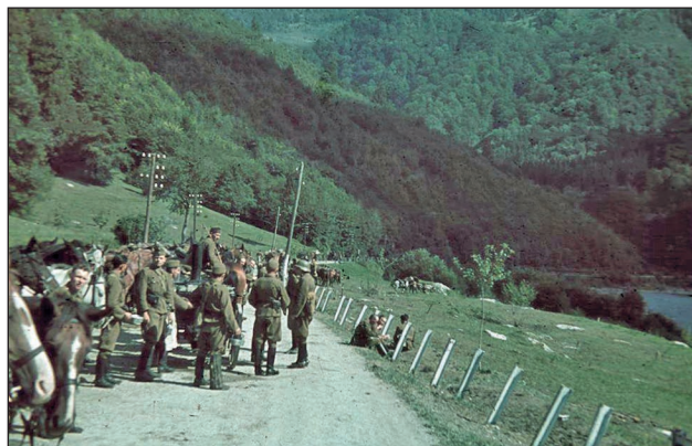
5. ábra. Rövid pihenő valahol a Kárpátokban

Az „O” azaz orosz határ 100 méter feletti, nehezen járható terepen húzódtott. A németek júniusi támadása egybeesett a Kárpátokban lévő nagy esőzések időszakával, ami miatt a lezúduló nagy mennyiségű csapadék még nehezebbé tette a hegyekben történő tevékenységet. A magyar határzár viszonylag kis mértékben kiépített tábori erődítésekkel állt, a hágókon átvezető utakat pedig század, zászlóalj erejű támpontok biztosították. A teljes kiépítéshez szükséges anyagok azonban már a határt biztosító dandá-