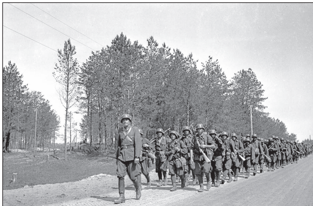
4. ábra. Gyalogmenetben

tott fel. Az újonnan létrehozott magyar királyi 2. honvéd lövészdandár parancsnokság is az új páncélos magasabbegység alárendeltje lett, amit a megszüntő 15. gyalogezred törzséből állított fel az 5. gépkocsizó zászlóalj. 10 Az alárendelt zászlóaljak a magyar királyi 4. (5. és 6.) honvéd gépkocsizó lövész zászlóalj megnevezést kapták. A páncéltörő ágyús szakaszukat átadták a V., VIII. és a II. hadtestközvetlen kerékpáros zászlóaljaknak. A zászlóaljba beosztott puskás századai pedig alosztályonként 8 golyószóróval, 4 állványos golyószóróval, 2 nehézpuskával és 2 gránátvetővel rendelkeztek.