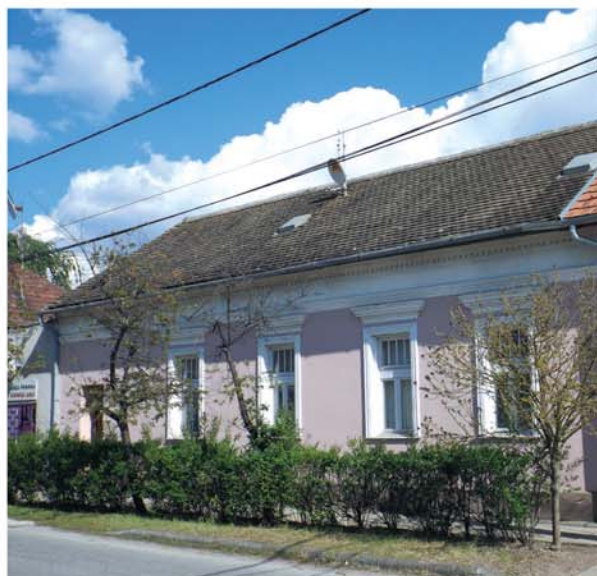
A nyaralók mai állapotukban a hozzáértés és gondosság változó szintjét tükrözik