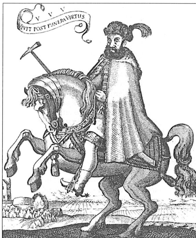
Thurzó György (1557–1616), az 1606-os füleki zendülés miatt összehívott haditörvényszék elnöke

szókkal illeti, gyalázza, jó hírében, nevében megbecstelelni, kissebbíti, a' Hadi Széken revideáltassék dolga, s ha meg nem bizonyíthatya a' felebarátyára kent gyalázatot, nyelv váltságon maradjon" 22