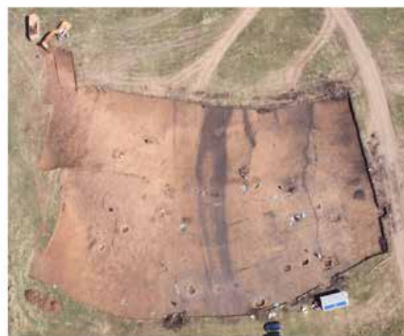
A magyarvistai (Viștea, Kolozs megye, Románia) kelta temető