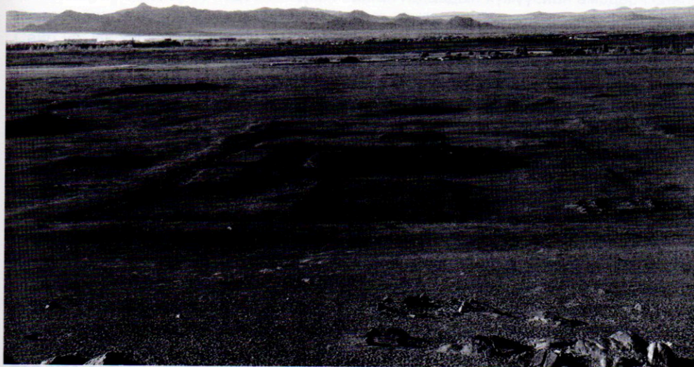
Зураг 3. Ховдын Шар сүмийн туурь. 2010

Позднеевын бичсэнээр Манжийн хааны зарлигийн дагуу буюу түүний хөрөнгөөр баригдсан хүрээ хийдүүд нь (Амарбаясгалант хийд, Дуутын хүрээ, Шар сүм, Дамбадаржаа хийд) ерөнхийдөө гурван хэсэгтэй (Mongolia, 1-р боть, 152-р х.). Гадаах хүрээлсэн хэрэм нь улаан тойпуугаар хийгдсэн ба хийдийн өмнө Цам буюу наадмын талбайтай байна. Уг хүрээ хийдүүд байгуулагдсан түүхийг монгол, төвд, хятад, манж 4 хэлээр бичигдсэн гэрэлт хөшөөг „Түүхийн сүм” нэртэй газарт байрлуулсан юм. Сүм хийдийн барилгаа эхлүүлэхийн өмнө Манжийн хаан лам нарын тоог тогтоож, дуган барих лам нарын сууцыг барих, тэднийг тэтгэж лам нарт өөрийн сангаасаа цалин олгосон байна. Сүүлд эдгээр сүм хийдүүд биеэ даан, өөрсдийн мал сүргийг өсгөж, өөрсдийн орлого зарлагатай болсон (Religion, 37-р х.). Позднеев Ховдын Шар сүмд очихдоо лам нарын сууцуудыг бас харжээ (Religion, 41-р х.). Позднеевын тэмдэглэсэнээр эдгээр хүрээ хийдүүд хутагт нарын хүрээнүүдийг бодвол арай ядуувтар гэж тэмдэглэжээ. Манж, хятадын сүм хийд ба Манжийн хааны ивээн тэтгэсэн хийдүүд нь манж хэлээр бичигдсэн “эзний сүлд” ба амбан, тайж, лам нар ивээн тэтгэсэн гэдгийг харуулсан “rien-e”-тэй байдаг байна (Religion, 103-104-р х., Mongolia, 1-р боть, 153-154-р х.). Асар, дуган нь голдуу хятад барилгын хийц загвартай. Манжийн хааны бариулсан хийдүүдийн зарим нь (жишээ нь Амарбаясгалант, Дамбадаржаа) сүүлдээ Их шавийн хийдүүд болсон.