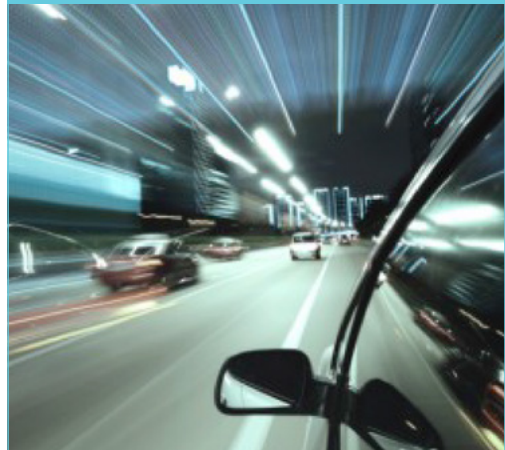
3. ábra: Tavaly 150 ezer kilométert tettek meg önvezető járművek Pekingben.

Mennyire legyen biztonságos az önvezető jármű [1]?