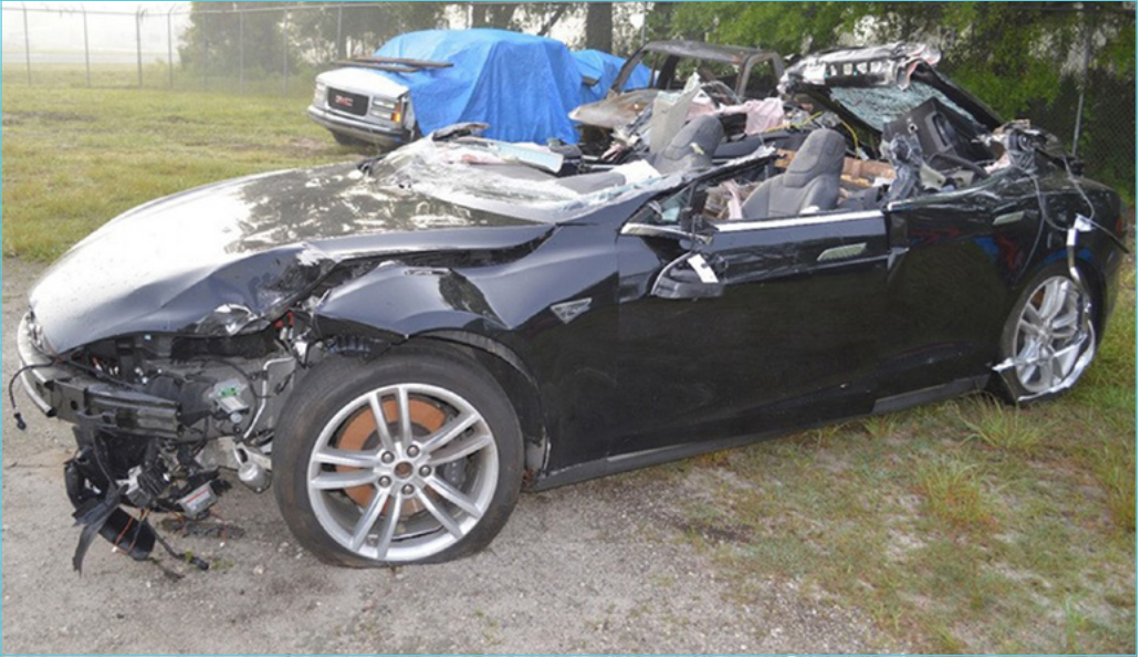
2. ábra: A Tesla halálos balesetének járműve [6]

történhetett meg ez az eset. Ugyanis, ha nem lett volna a vezetéssegítő rendszer, nem adott volna a járművezetőnek hamis biztonságérzetet, akkor figyelte volna az utat és környezetét, úgy pedig időben észrevette volna a közeledő veszélyt.