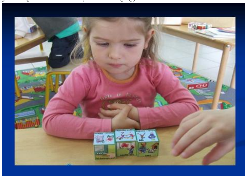
3. ábra: Barcoba I játék az Okoskockákkal

2.1. Barcoba I. (csapatjáték, versenyjáték, páros játék – 3. ábra). Instrukció: „Gondoltam egy dologra. Mondom a jellemzőit. Amely kockára nem jellemző, amit mondtam, azt rakjátok félre. Ha ügyesek vagytok, akkor csak az a kocka marad középen, amire gondoltam!”