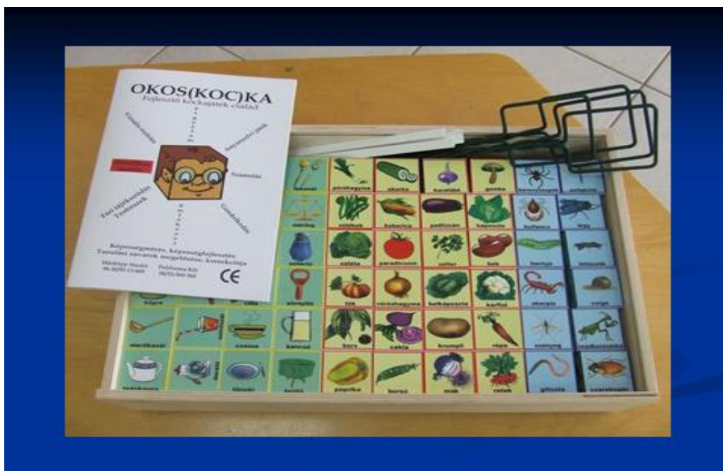
1. ábra: Az Okoskocka fejlesztő játékszalád (forrás: a Szerző)

Az eszközökkel való játéklehetőségek végtelenek, és sokoldalúak. A sokszínűséget a tematizált játékok jelentik, pl. szókincsfejlesztő játékok, szófajgazdagító játékok, fogalmi gondolkodást fejlesztő játékok, fogalmi hálót fejlesztő játékok, mondat-