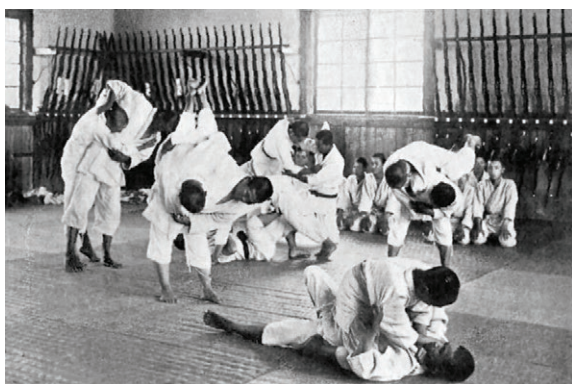
The Foundations of Japan (1922) (Wikipedia)

dedukció módszerével következtethetünk a jūdō és a jiu-jitsu közötti csata megrendezésének valós okairól és a kimenetel jelentőségéről is. A források beszerzését a Magyarországon elérhető könyvek, tanulmányok és egyéb publikációk megkeresésével kezdtük. A következő könyvtárakban gyűjtöttünk anyagot: Fővárosi Szabó Ervin Könyvtár, a Japán Alapítvány, a Nemzeti Közszerzési Egyetem és a Testnevelési Egyetem könyvtára. Mivel az itthoni források megkeresése nem nevezhető teljes körű kutatásnak, felvettük a kapcsolatot azokkal a japán szervezetekkel, akik rendelkezhetnek némi információval az eseményről. Megkeresésünkre a Tokiói Rendőrség referense készségesen rendelkezésünkre bocsátott néhány japán nyelvű anyagrészt, amelyek a rendőroktatás kora újkori történetével foglalkoztak. A globális jūdō központi intézetétől, a Kodokan Intézetétől azt a választ kaptuk, hogy az intézet semmiféle forrással nem rendelkezik a mérkőzésről. Bár az állítás mögött inkább egy udvarias visszautasítást sejtünk, valószínűsíthető, hogy az intézet tényleg nagyon kevés információval rendelkezik az 1886-os versenyről. A Nemzetközi Jiu-Jitsu Szövetségtől a kézirat lezárásáig nem érkezett válasz.