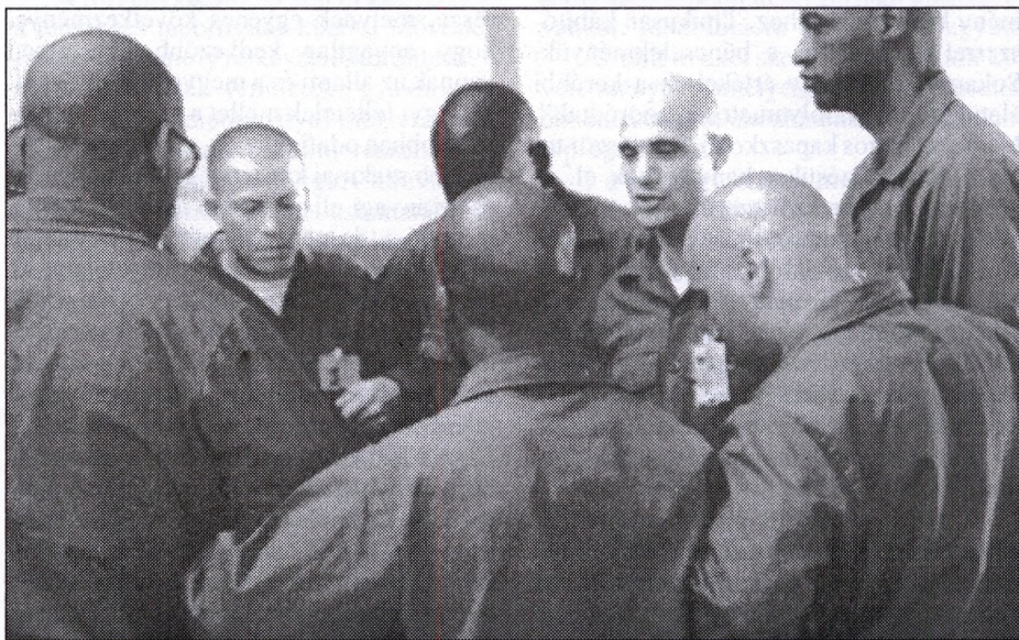
A foglalkozást közös fogadalomtétellel fejezik be

Minden reggel „bemelegítő” foglalkozásként néhány szóban valamennyi csoporttag köszönti a többieket, elmondja az előző napra vonatkozó érzéseit és gondolatait, valamint megfogadja, hogy ezt az új napot maximálisan felhasználja saját és a csoport gyarapodása érdekében. A gyűlést közös fogadalom kántálásával, az együttműködés fontosságának és eredményességének hangsúlyozásával zárják. Komoly rítusa van a mondatok egyre gyorsabb és hangosabb ismétlésének. (Engem a sportmérkőzéseket megelőző pszichés felkészí-