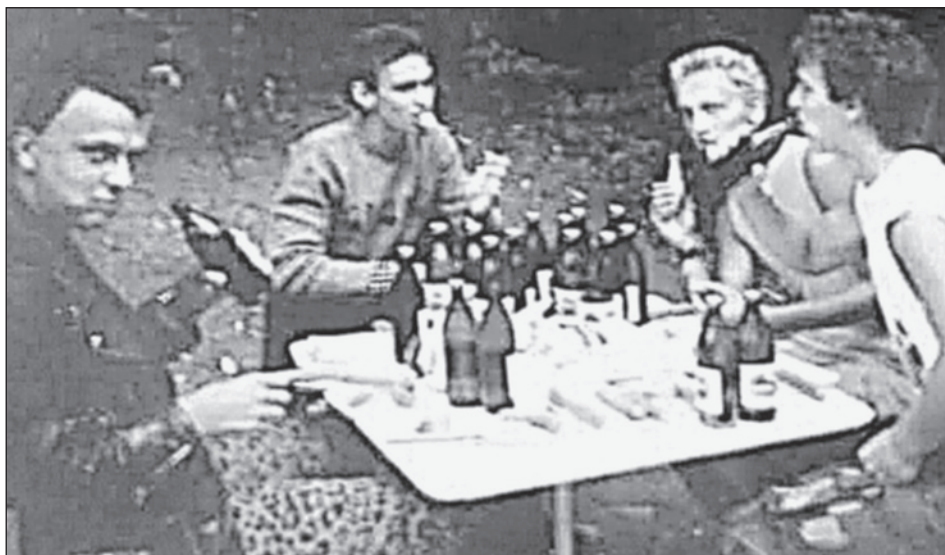
A 'Közellenség' zenekar

Rögtön az előzmények vizsgálatánál a 'CPg' ügyére emlékeztető analógiákra akadunk. Akárcsak a szegediek, a veszprémi fiúk is tizenéves lázadó fiatalok. A zenekaron keresztül pedig a rendszer ellen akartak tiltakozni, mert mint fogalmaztak, az rendőrállam volt.