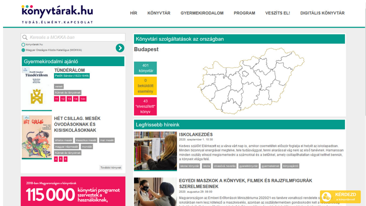
1. ábra A könyvtárak.hu portál főoldala (2020. szeptember 2-án)

szolgáltatásról és annak igénybe vételének lehetőségeiről, mikéntjéről. Másrészt az is motivált bennünket, hogy különböző felületeken, elszigetelten működnek olyan hasonló célcsoportnak szóló szolgáltatások, amiket érdemes lenne egy helyen elérhetővé tenni, ezzel is segítve az érdeklődőket. Ilyen szempontok alapján integráltuk be és fejlesztettük tovább ezen a portálon a korábbi Gyermekirodalmi adatbázist (jelenleg Gyermekirodalmi ajánló ) és a Veszíts el egy könyvet játékot is.