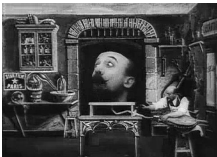
A gumifejű ember (L'homme à la tête de caoutchouc. Georges Méliès, 1901)

panoráma és a fantazmagória szinte egyidejű megjelenésével foglalkozom: a panoráma 1796-ban [1] jelent meg Edinburghben, a fantazmagória 1797-ben Párizsban. Két év leforgása alatt tehát különböző technológiák egyesülése két új médiumot hoz létre, melyek látszólag ugyanazon forrásvidékről származnak. Mindazonáltal a két médium felosztotta a közös területet. A panoráma a világ sajátját tételét és a történelem ünneplését vitte színre. A birodalmi kultúrához kapcsolódott, ahol a legfontosabb dolog a terület (amelyet valamilyen módon meghódítottak és megvédtek), és amely az áruforgalmat és az erőforrások kitermelését lehetővé tette. A fantazmagória túllépett ezen a területen. A nézőket a halottak birodalmával hozta érintkezésbe, a környező valóság kísérteties aspektusait tárta fel, kíváncsiságot és félelmet váltott ki. Nem pusztán a mágia kultúráján belül mozgott, a nézők érzelmi reakcióit is tesztelte. Ebben az értelemben a belső világgal és a spirituális valósággal foglalkozott, s azzal a képességünkkel, hogy megbirkózzunk velük. Bizonyos értelemben a panoráma a földrajzi kiterjedésről szólt, míg a fantazmagória a transzcendentális hálózatról. Az előbbi politikai gépezet volt, míg az utóbbi pszichoanalitikus gépezet. A két médium megjelenésével két különböző történet kezdődött el.